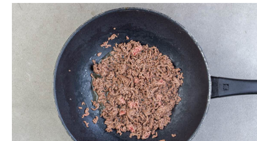
3. Hack anbraten

Mit ca. 170ml Wasser ablöschen und unter Rühren einmal aufkochen lassen. Die Hitze reduzieren, den Brokkoli zugeben und alles abgedeckt bei mittlerer Hitze 6-9Min. köcheln lassen, bis die Flüssigkeit leicht eingedickt und der Brokkoli gar ist, ggf. esslöffelweise mehr Wasser zugeben. Mit Salz, Pfeffer und Zucker abschmecken.