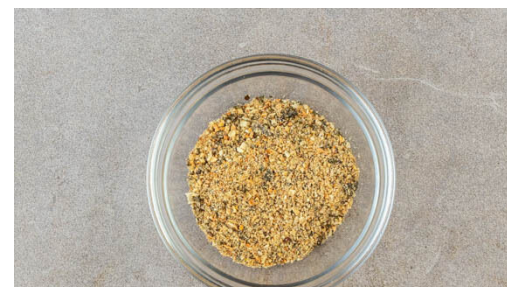
5. Topping vorbereiten

Die Mandelblättchen in einer kleinen Pfanne ohne Zugabe von Fett bei mittlerer Hitze 1-2Min. goldbraun anrösten. Vorsicht , sie können schnell zu dunkel werden. Zum Abkühlen aus der Pfanne nehmen, die Pfanne aufbewahren. In einem großen Topf ausreichend gesalzenes Wasser für die Pasta zum Kochen bringen. Den Knoblauch schälen und halbieren.