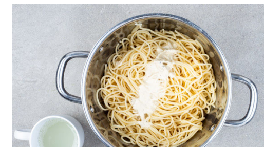
6. Pasta fertigstellen

Die Zitronenschale abreiben, dann die Zitrone auspressen. Ca. 1EL Mandeln als Garnitur aufbewahren, die übrigen Mandeln mit dem Knoblauch , 2TL Zitronenschale , ca. 2/3 der Hefeflocken , 2EL Olivenöl und 250-300ml Wasser in einem hohen Gefäß pürieren. Das Wasser langsam zugeben und darauf achten, dass die Creme nicht zu flüssig wird. Mit Salz und Pfeffer abschmecken.