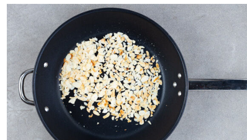
2. Mandeln anrösten

Die Oliven halbieren oder grob schneiden und für die letzten ca. 5Min. der Garzeit mit 2-3EL Zitronensaft unter die Auberginen mengen.