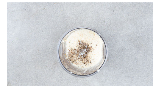
3. Mandelcreme zubereiten

Die Pasta in das kochende Wasser geben und in 7-9Min. bissfest kochen. Ca. 1 Tasse Pastawasser abschöpfen, dann die Pasta in ein Sieb abgießen und abtropfen lassen. Inzwischen die Kürbiskerne in der kleinen Pfanne ohne Zugabe von Fett bei mittlerer Hitze 2-4Min. anrösten. Aus der Pfanne nehmen, fein hacken und mit den restlichen Hefeflocken sowie 1 Prise Salz vermengen.