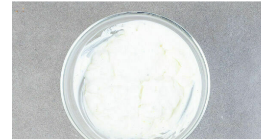
3. Joghurt würzen

Die Tomaten in ca. 1cm große Würfel schneiden und mit 1 kräftigen Prise Salz würzen.