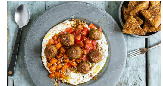
6. Anrichten und servieren

Den Knoblauch schälen und fein reiben oder sehr fein würfeln. Den Joghurt mit dem Knoblauch , 1TL Salz und 1 kräftigen Prise Pfeffer verrühren.