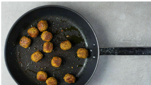
4. Falafeln braten

Den Backofen auf 240°C (220°C Umluft) vorheizen. Die Karotten ggf. schälen, in kleine Würfel schneiden und mit der nordafrikanischen Gewürzmischung , 1EL Honig und 2 Prisen Salz in einen mittelgroßen Topf geben. Knapp mit Wasser bedeckt aufkochen und abgedeckt ca. 7Min. köcheln lassen. Dann noch ca. 8Min. bei mittlerer bis starker Hitze ohne Deckel kochen, bis das Wasser verdampft ist.