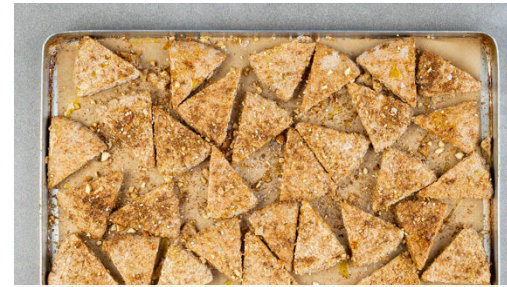
2. Pita backen

Die Falafeln in einer großen Pfanne mit 3EL Olivenöl bei mittlerer Hitze ca. 4Min. rundum goldbraun anbraten. Tipp: Je nach Größe der Pfanne ggf. eine zweite Pfanne verwenden.