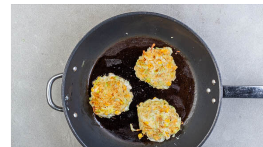
3. Bratlinge ausbacken

Die Gurke , die Paprika und den restlichen Mais mit 3EL Essig vermengen und den Salat mit Salz und Pfeffer abschmecken.