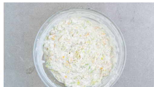
2. Teig zubereiten

Nebenher die Gurke längs halbieren und in dünne Scheiben schneiden. Die Paprika vierteln, entkernen und in ca. 2cm große Stücke schneiden.