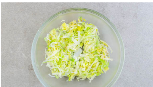
1. Lauch garen

Energie 910kcal, Fett 53.9g, Kohlenhydrate 84.2g, Eiweiß 17.5g