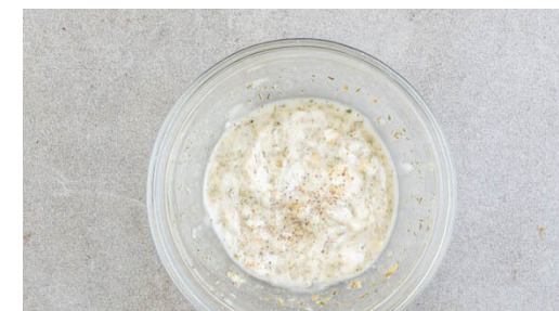
6. Dip zubereiten

In der Pfanne 1EL Pflanzenöl bei mittlerer Hitze erwärmen. 2-3EL Teig portionsweise für jeden Bratling in die Pfanne geben und auf diese Weise je nach Größe der Pfanne mehrere Bratlinge gleichzeitig backen. Die Bratlinge 3-4Min. garen, dann wenden und weitere 3-4Min. backen. Ggf. die Hitze reduzieren und etwas mehr Öl hinzugeben. Insgesamt ca. 12 Bratlinge zubereiten.