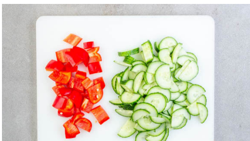
4. Gemüse schneiden

Den Lauch längs halbieren, dann in dünne Streifen schneiden. In einer großen Pfanne mit 2EL Pflanzenöl und 1 kräftigen Prise Salz bei mittlerer Hitze ca. 2Min. anbraten, bis der Lauch weich wird. In eine große Schüssel umfüllen. Die Pfanne auswaschen und beiseitestellen.