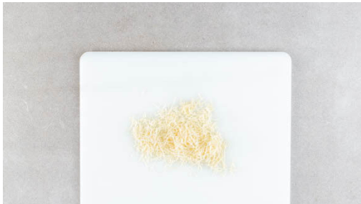
4. Käse hacken

Das Tomatenmark unterrühren und ca. 2Min. mitbraten. 1,2L Wasser angießen, die Suppe mit ½-1TL Salz und 1 kräftigen Prise Pfeffer würzen und 5-6Min. köcheln lassen.