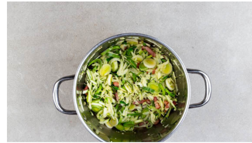
2. Gemüse mitbraten

Den Speck in einem großen Topf mit 2EL Olivenöl bei mittlerer bis starker Hitze ca. 3Min. braten, bis er leicht gebräunt ist.