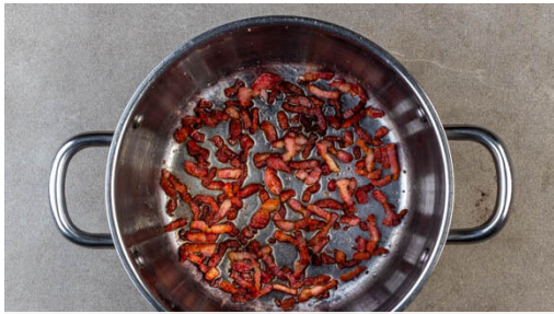
1. Speck braten

Energie 618kcal, Fett 32.4g, Kohlenhydrate 55.5g, Eiweiß 23.4g