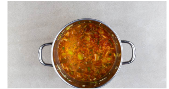
3. Suppe kochen

Die Zucchini grob reiben. Die Zucchini und den Lauch zum Speck in den Topf geben und 3-4Min. mitbraten.