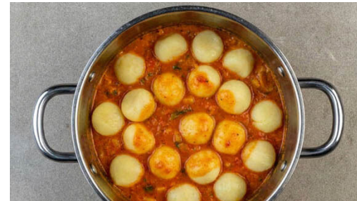
5. Gnocchi zugeben

Den Käse nach Belieben grob oder fein hacken.