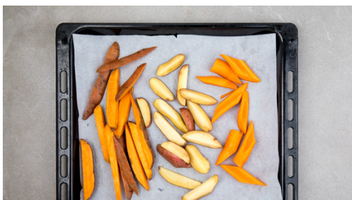
1. Gemüse vorbereiten

Energie 650kcal, Fett 25.3g, Kohlenhydrate 85.6g, Eiweiß 13.7g