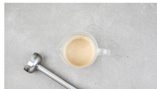
5. Dressing zubereiten

Den ungeschälten Knoblauch ebenfalls auf das Backblech geben. Das Gemüse mit der Gewürzmischung , 2EL Olivenöl sowie je ½TL Salz und Pfeffer vermengen und im Ofen 15-20Min. rösten, bis die Kartoffeln an den Rändern knusprig braun sind. Den Knoblauch nach ca. 5Min. vom Blech nehmen und abkühlen lassen.