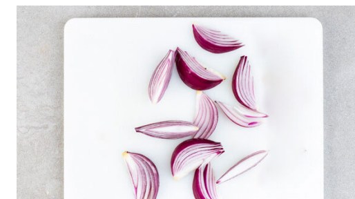
3. Zwiebeln vorbereiten

Den gebackenen Knoblauch schälen und mit dem Tahini , 4-5EL Wasser und 1 Prise Salz in einem hohen Gefäß mit einem Stabmixer zu einem leicht dickflüssigen Dressing pürieren, dabei ggf. löffelweise Wasser zugeben. Die Zitronenschale abreiben, dann die Zitrone halbieren und auspressen. Das Dressing mit Zitronensaft und Salz abschmecken.