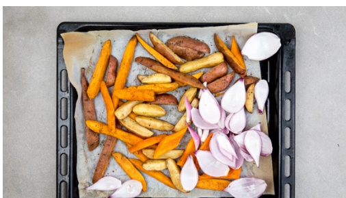
4. Zwiebeln mitbacken

Den Backofen auf 240°C (220°C Umluft) vorheizen. Die Süßkartoffeln und die Kartoffeln samt Schale in 2-3cm breite Spalten schneiden. Die Karotten ggf. schälen, längs halbieren und in 3-4cm lange Scheiben schneiden. Das Gemüse auf ein mit Backpapier ausgelegtes Backblech geben.