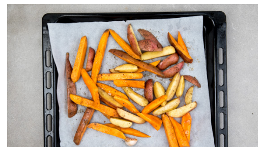
2. Gemüse rösten

Die Zwiebeln mit 1EL Olivenöl vermengen, zu den Kartoffeln auf das Backblech geben und 8-10Min. mitbacken, bis sie an den Enden goldbraun sind. Ggf. ein zweites Blech verwenden.