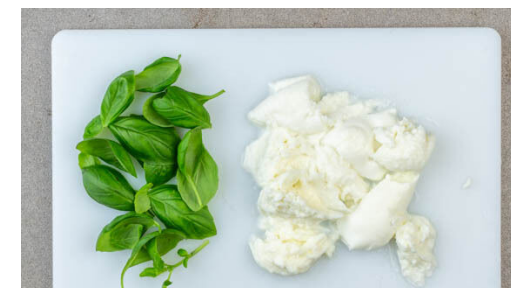
6. Garnitur vorbereiten

Die ½ der Schalotte schälen und grob würfeln. Die Zitrone halbieren und auspressen. Die Schalottenwürfel , 2EL Zitronensaft , 2TL Zucker, ¼TL Senf und 1 kräftige Prise Salz in einem hohen Gefäß pürieren. Langsam 2EL Olivenöl zugeben und alles zu einem cremigen Dressing pürieren. Den Mohn zugeben und ein-, zweimal mit der Pulse-Funktion pürieren. Mit Salz abschmecken.