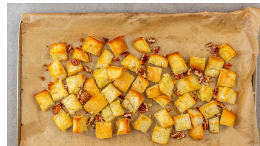
2. Croûtons rösten

Den Fenchel längs halbieren und längs in feine Streifen schneiden. Tipp: Am besten einen Gemüsehobel verwenden, falls vorhanden. Die Gurke in dünne Scheiben schneiden. Den Fenchel und die Gurkenscheiben gut mit dem Dressing vermengen.