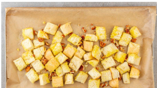
1. Croûtons vorbereiten

Energie 725kcal, Fett 46.5g, Kohlenhydrate 60.9g, Eiweiß 18.1g