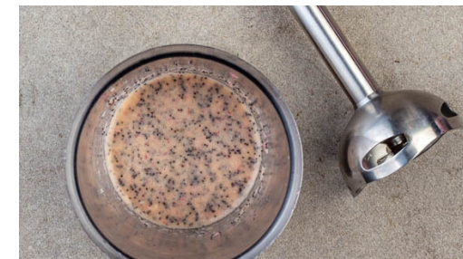
3. Dressing zubereiten

Das Backblech aus dem Ofen nehmen und die Croûtons etwas abkühlen lassen. Den Apfel halbieren, entkernen und in dünne Scheiben schneiden. Die Apfelscheiben , die Croûtons und die Pekannüsse mit dem Fenchel , den Gurken und dem Dressing vermengen. Mit Salz und Pfeffer abschmecken.