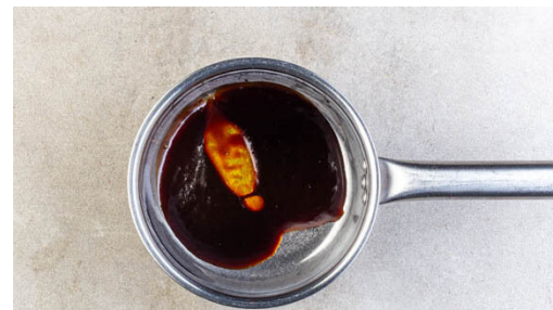
2. Glasur vorbereiten

Das Fleisch in eine mittelgroße Auflaufform geben und von beiden Seiten mit etwas Teriyaki-Honig-Glasur bestreichen. Anschließend im Ofen 8-10Min. garen, dabei das Fleisch regelmäßig mit der Glasur bestreichen, bis alles aufgebraucht ist.