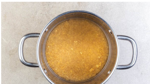
1. Bulgur kochen

Energie 619kcal, Fett 19.6g, Kohlenhydrate 68.5g, Eiweiß 40.9g