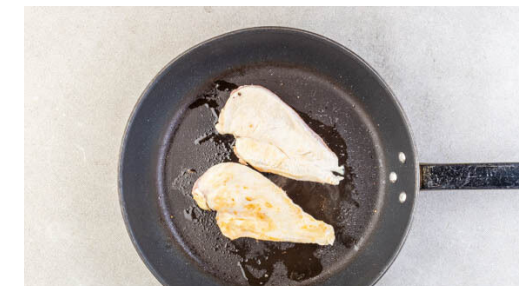
3. Fleisch anbraten

Inzwischen die Gurken mit einer Küchenreibe grob raspeln und mithilfe eines Küchentuchs gut auswringen. Die Limettenschale fein abreiben, dann die Limette in Spalten schneiden. Den Koriander samt Stängeln grob schneiden.