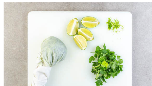
5. Zutaten vorbereiten

Währenddessen die Teriyakisauce in einem kleinen Topf bei mittlerer Hitze 1-2Min. sanft einköcheln lassen und gut mit 2TL Honig verrühren.