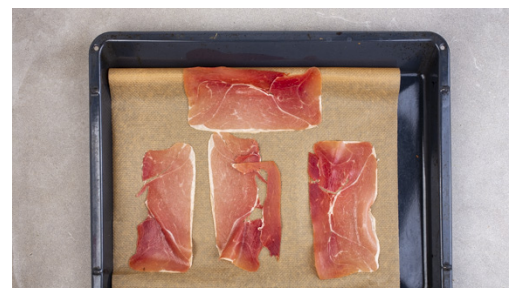
2. Schinken rösten

Den Backofen auf 200°C (180°C Umluft) vorheizen. Die Lauchzwiebel schräg in feine Ringe schneiden.