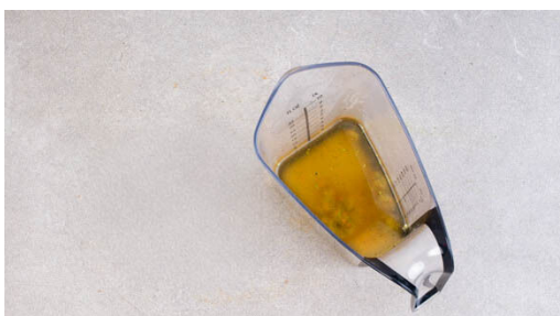
4. Brühe vorbereiten

Die Gnocchi in einer großen Pfanne mit 4EL Olivenöl bei mittlerer Hitze 6-8Min. goldbraun anbraten.