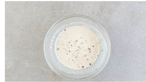
2. Sauce vorbereiten

Den Backofen auf 200°C (180°C Umluft) vorheizen. Die Gurken der Länge nach vierteln, dann quer in ca. 1cm breite Stücke schneiden. Die Zwiebel schälen und in feine Streifen schneiden. Die Tomaten grob würfeln.