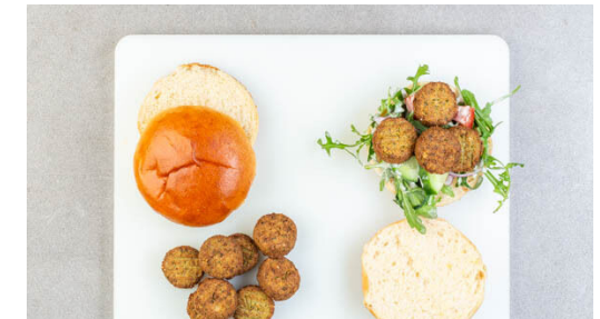
6. Burger belegen

Die Gurken , die Zwiebeln und die Tomaten mit dem Rucola und der Tahinisaucen vermengen.