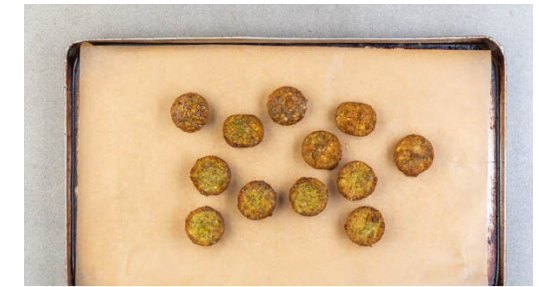
3. Falafeln aufbacken

Den Knoblauch schälen und sehr fein würfeln oder durch eine Knoblauchpresse drücken. Das Tahini mit dem Knoblauch , 2EL hellem Essig und 5-6EL Wasser zu einer glatten Sauce verrühren. Mit Salz und Pfeffer abschmecken.