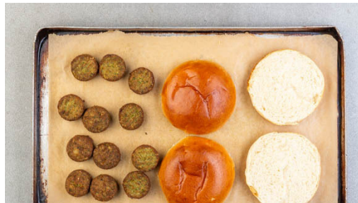
4. Brötchen aufbacken

Die Falafeln auf einem mit Backpapier ausgelegten Backblech mit 2EL Pflanzenöl vermengen und im Ofen ca. 10Min. aufbacken.