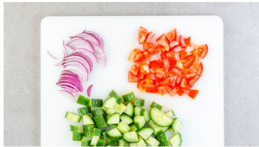
1. Salat vorbereiten

Energie 552kcal, Fett 26.6g, Kohlenhydrate 59.5g, Eiweiß 17.5g