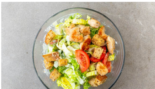
5. Salat fertigstellen

Die ½ der Zitronenschale abreiben und die abgeriebene Zitronenhälfte auspressen. Die übrige Knoblauchzehe schälen und durch eine Knoblauchpresse drücken oder sehr fein würfeln. Die Zitronenschale , den Zitronensaft , den Knoblauch , den Joghurt , ½EL Senf, 1EL Olivenöl, 1TL Balsamicoessig und je 1 Prise Salz und Pfeffer zu einem Dressing verrühren.