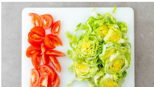
4. Salat & Tomaten schneiden

Den Backofen auf 200°C (180°C Umluft) vorheizen. 1 Knoblauchzehe schälen und durch eine Knoblauchpresse drücken oder sehr fein würfeln, dann mit 2EL Olivenöl und je 1 Prise Salz und Pfeffer verrühren. Das Brötchen in ca. 1cm große Würfel schneiden, in einer Auflaufform mit dem Knoblauchöl vermengen und im Ofen in 8-10Min. goldbraun und knusprig backen.