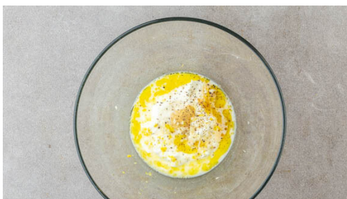
2. Dressing zubereiten

Den Romanasalat vom Strunk befreien und in ca. 1cm breite Streifen schneiden. Die Tomaten jeweils in 8 Spalten schneiden.