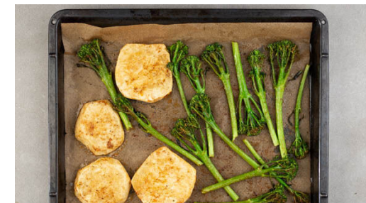
3. Gemüse fertigrösten

Den Fisch mit kaltem Wasser abspülen, trocken tupfen und evtl. vorhandene Gräten entfernen. 1EL Olivenöl bei mittlerer bis starker Hitze in der Pfanne erwärmen, dann den Fisch hineingeben und ca. 3Min. braten. Vorsichtig wenden und 1-2Min. weiterbraten.