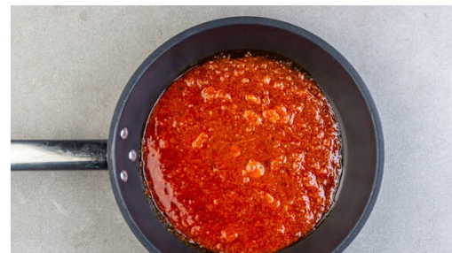
2. Harissa verfeinern

Die Dillspitzen abzupfen und fein schneiden. Den Feta mit dem Joghurt und 2TL Honig in einem hohen Gefäß mit einem Stabmixer cremig pürieren. Die ½ des Dills unterheben und die Fetacreme mit Salz und Pfeffer abschmecken.