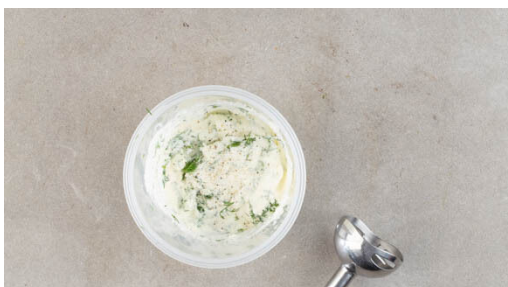
4. Fetacreme pürieren

Den Backofen auf 240°C (220°C) vorheizen. Die ½ der Gewürzmischung mit 3EL Olivenöl sowie je 1 kräftigen Prise Salz und Pfeffer verrühren. Den Sellerie schälen und in ca. 2cm dicke Scheiben schneiden. Auf einem mit Backpapier ausgelegten Backblech rundum mit dem Würzöl bestreichen und ca. 15Min. im Ofen rösten.