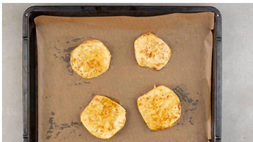
1. Selleriesteaks rösten

Energie 679kcal, Fett 48.4g, Kohlenhydrate 17.9g, Eiweiß 39.6g