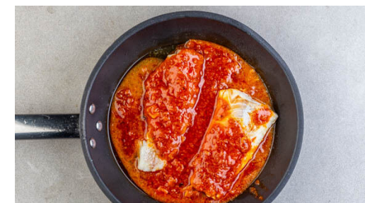
6. Fisch verfeinern

Nach ca. 15Min. Backzeit die Brokkolini auf einem zweiten mit Backpapier ausgelegten Backblech mit 2EL Olivenöl, der restlichen Gewürzmischung sowie je 1 kräftigen Prise Salz und Pfeffer würzen. Das Gemüse 8-12Min. zusammen im Ofen backen, bis es leichte Röstspuren aufweist. Die Position der Bleche zur Hälfte der Backzeit tauschen.