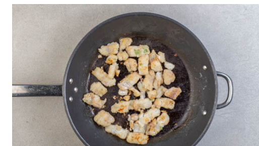
6. Fisch braten

Die Basilikumstängel mit 3EL Mehl und je 1 Prise Salz und Pfeffer vermischen. Den Fisch mit kaltem Wasser abspülen, trocken tupfen und in der Mehlmischung wenden, dabei überschüssiges Mehl abklopfen. Den Fisch beiseitestellen.