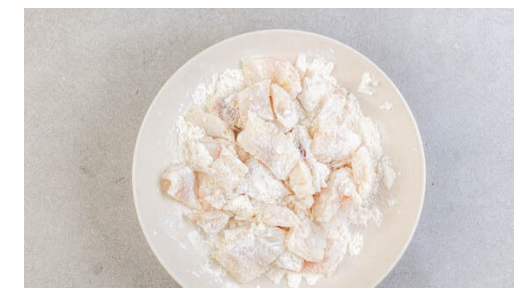
3. Fisch panieren

Die Croûtons , die Lauchzwiebeln , die Gurken , die Tomaten , die Oliven und die Basilikumblätter mit der Vinaigrette vermengen.