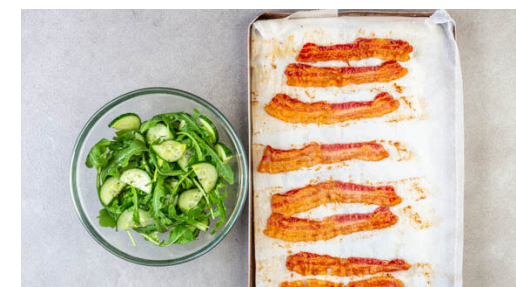
6. Bacon & Salat zubereiten

Eine Auflaufform mit ½EL Pflanzenöl fetten. Die Brotmischung darin verteilen, leicht andrücken und mit der Eier-Milch-Mischung übergießen. Mit dem restlichen Käse bestreuen und gut abgedeckt bis zu 24 Stunden kalt stellen.