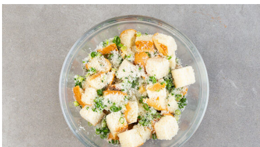
1. Zutaten vorbereiten

Energie 660kcal, Fett 42.0g, Kohlenhydrate 44.0g, Eiweiß 27.9g