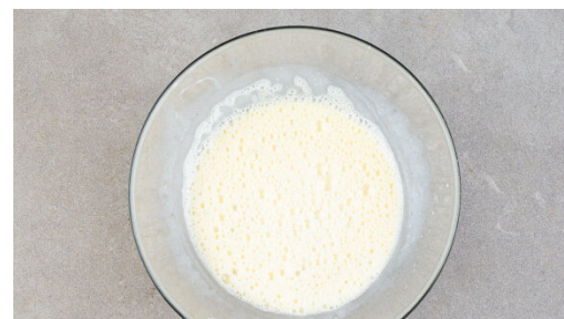
2. Guss anrühren

Die Gurke längs halbieren und in dünne Scheiben schneiden. 2EL Pflanzenöl, 1EL Essig und je 1 Prise Salz, Pfeffer und Zucker zu einem Dressing verrühren. Die Gurke und das Dressing ebenfalls abgedeckt kalt stellen.