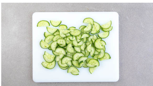
4. Salat vorbereiten

Die Brötchen in ca. 2cm große Würfel schneiden. Den Käse fein hacken. Den Schnittlauch in kleine Ringe schneiden und mit den Brotwürfeln und der ½ des Käses vermengen.