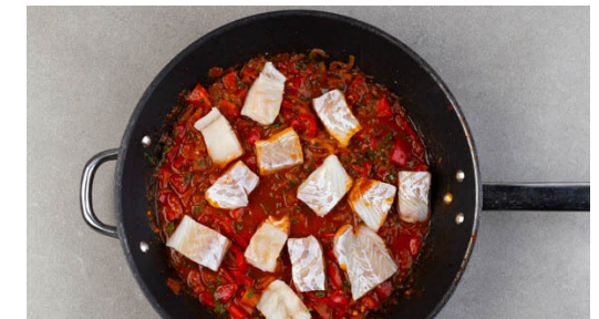
6. Fisch garen

Die Paprika , die Tomaten , die Gewürzmischung , 1TL Zucker, 1 kräftige Prise Salz und das aufgekochte Wasser in die Pfanne geben und zum Kochen bringen, dann bei mittlerer Hitze ca. 12Min. köcheln lassen, bis die Sauce die gewünschte Konsistenz hat.