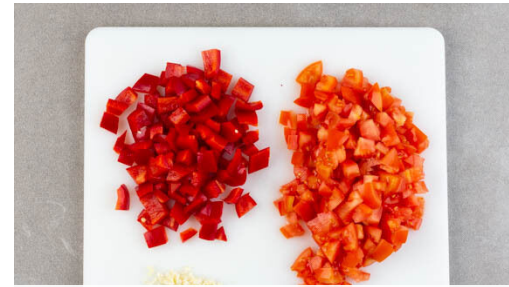
2. Gemüse schneiden

Inzwischen 225g Bulgur in den Topf mit dem kochenden Wasser rühren und abgedeckt bei niedriger Hitze 5-7Min. sanft köcheln lassen, bis das Wasser aufgesaugt und der Bulgur gar ist. Noch ca. 5Min. ohne Hitzezufuhr ziehen lassen.