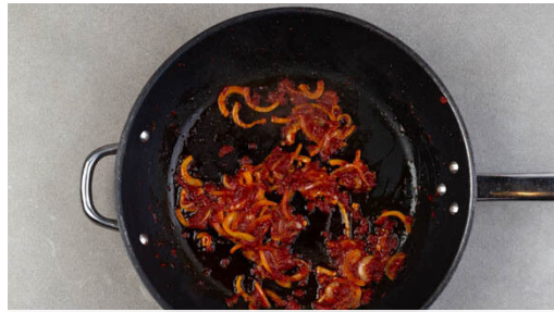
1. Zwiebeln anbraten

In einem mittelgroßen Topf 450ml leicht gesalzenes Wasser für den Bulgur zum Kochen bringen. Die Zwiebel schälen, halbieren und in feine Streifen schneiden. Die Zwiebeln und das Tomatenmark in einer mittelgroßen Pfanne mit 2EL Olivenöl bei mittlerer Hitze 4-7Min. anbraten, dabei regelmäßig umrühren.