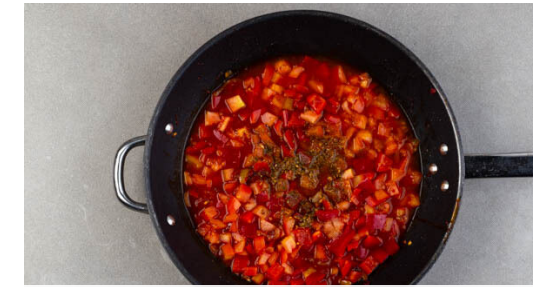
3. Sauce köcheln

Den Schnittlauch und die Petersilie samt Stängeln fein schneiden und die ½ der Kräuter in die Sauce rühren. Mit Salz und Pfeffer abschmecken.