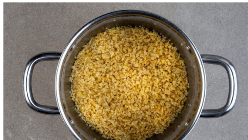
4. Bulgur kochen

In einem mittelgroßen Topf 450ml leicht gesalzenes Wasser für den Bulgur zum Kochen bringen. Die Zwiebel schälen, halbieren und in feine Streifen schneiden. Die Zwiebeln und das Tomatenmark in einer mittelgroßen Pfanne mit 2EL Olivenöl bei mittlerer Hitze 4-7Min. anbraten, dabei regelmäßig umrühren.