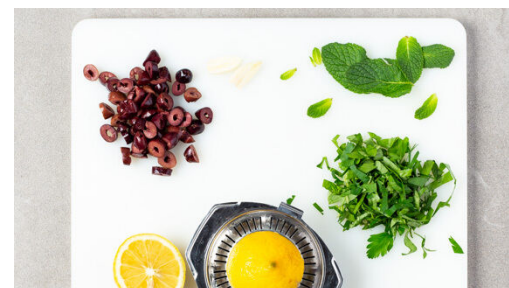
5. Pesto vorbereiten

Die Sonnenblumenkerne__ in einer mittelgroßen Pfanne ohne Zugabe von Fett bei mittlerer Hitze 2-4Min. anrösten, bis sie knistern und goldbraun sind. Zum Abkühlen aus der Pfanne nehmen.