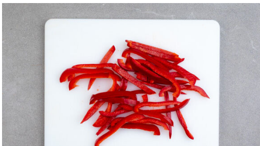
1. Paprika schneiden

Energie 776kcal, Fett 37.2g, Kohlenhydrate 86.9g, Eiweiß 22.4g