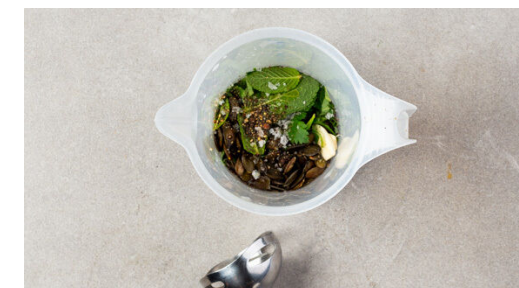
6. Zutaten pürieren

Die Petersilie samt Stängeln grob schneiden. Den Knoblauch schälen und halbieren. Die Oliven in Ringe schneiden.