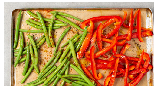
2. Gemüse rösten

Den Backofen auf 220°C (200°C Umluft) vorheizen. In einem großen Topf ausreichend gesalzenes Wasser für die Pasta zum Kochen bringen. Die Paprika vierteln, entkernen und in dünne Streifen schneiden.