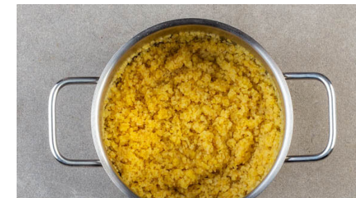
3. Bulgur kochen

Das Fleisch in einer heißen Grillpfanne oder auf dem Grill bei starker Hitze auf jeder Seite 4-5Min. braten, bis es durch ist. Auf einem Teller abgedeckt warm halten. Die Tomatenhälften mit der Schnittfläche nach unten ebenfalls bei starker Hitze ca. 4Min. grillen.