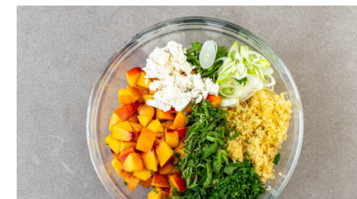
6. Salat fertigstellen

Den Bulgur in die kochende Brühe rühren und abgedeckt bei niedriger Hitze 5-7Min. sanft köcheln lassen, bis die Flüssigkeit Wasser aufgesaugt und der Bulgur gar ist. Noch ca. 5Min. ohne Hitzezufuhr ziehen lassen.