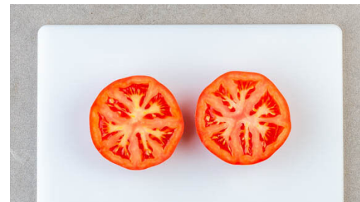
2. Tomate schneiden

In der Zwischenzeit die Lauchzwiebel schräg in feine Ringe schneiden. Die Nektarinen vierteln, entkernen und in kleine Würfel schneiden. Die Minzeblätter abzupfen und mit der Petersilie samt Stängeln fein schneiden.