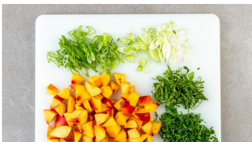
4. Salat vorbereiten

Ggf. den Grill vorbereiten. Für den Bulgur in einem kleinen Topf 300ml Wasser mit dem Brühwürz zum Kochen bringen. Die Gewürzmischung mit 1EL Olivenöl und 1 Prise Salz verrühren. Das Fleisch trocken tupfen, der Länge nach halbieren und mit dem Würzöl einreiben.