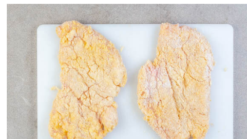
5. Schnitzel panieren

Das Fleisch trocken tupfen, horizontal in 2 gleich große Stücke schneiden und zwischen Frischhaltefolie mit einem Fleischklopfer oder einer schweren Pfanne ca. 0,5cm dünn klopfen. In einem tiefen Teller 2EL Mehl mit je 1 kräftigen Prise Salz und Pfeffer vermengen. In einem weiteren Teller 1 Ei verquirlen. Die Semmelbrösel in einem dritten Teller mit 1 Prise Salz vermengen.