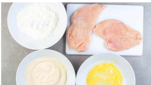
4. Panade vorbereiten

In einem mittelgroßen Topf 1EL Pflanzenöl mittelhoch erhitzen. Die Karotten im Topf mit ½TL Zucker, je 1 kräftigen Prise Salz und Pfeffer und 50ml Wasser 5-7Min. garen, bis sie durch sind und die Flüssigkeit größtenteils verdampft ist, dabei gelegentlich umrühren. Kurz vor Ende der Garzeit die Lauchzwiebeln und den Zitronenabrieb zugeben, mit Salz und Pfeffer abschmecken.