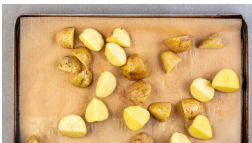
1. Kartoffeln rösten

Energie 725kcal, Fett 26.6g, Kohlenhydrate 79.0g, Eiweiß 38.9g