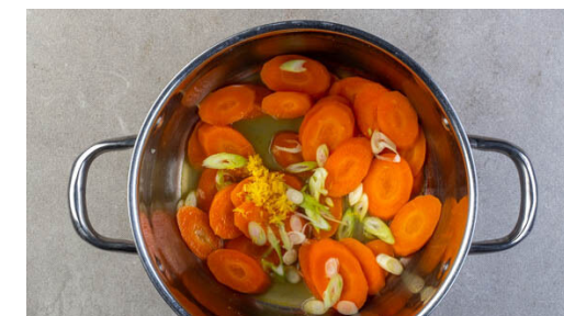
3. Karotten garen

Die Karotten ggf. schälen und schräg in ca. 0,5cm dünne Scheiben schneiden. Die Lauchzwiebel in feine Ringe schneiden. Die Sahne mit je 1 kräftigen Prise Salz und Pfeffer sowie ein paar Tropfen Wasser zu einem Dip verrühren. Ca. 1TL Zitronenschale abreiben und die Zitrone in Spalten schneiden.