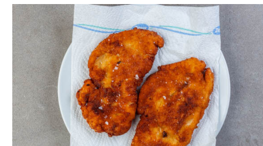
6. Schnitzel braten

Eine mittlere Pfanne ca. 1cm hoch mit Pflanzenöl befüllen und stark erhitzen. Das Fleisch der Reihe nach im Mehl, im Ei und in den Semmelbröseln wenden. Diesen Vorgang wiederholen.