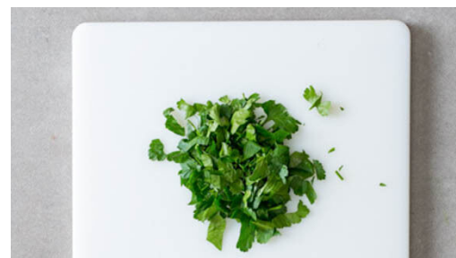
5. Petersilie hacken

Die Garnelen in einem Sieb mit kaltem Wasser abspülen, mit etwas Küchenkrepp trocken tupfen und mit der Zitronenschale , dem Knoblauch , der Peperoni sowie 2EL Olivenöl vermengen.