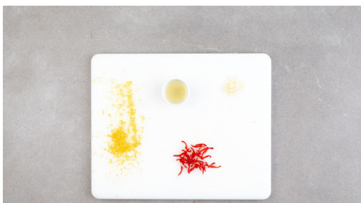
1. Zutaten vorbereiten

Energie 712kcal, Fett 27.9g, Kohlenhydrate 86.2g, Eiweiß 31.2g