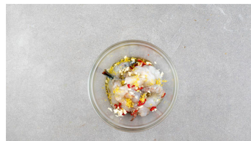
2. Garnelen vorbereiten

Die Tomaten vierteln. Das Kerngehäuse entfernen, aber aufbewahren. Das Tomatenfruchtfleisch in feine Streifen schneiden. Das Kerngehäuse mit Zitronensaft nach Geschmack und 1EL Olivenöl in einem hohen Gefäß pürieren und mit Salz abschmecken.