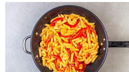
6. Pasta fertigstellen

Die Pasta in das kochende Wasser geben und in 7-9Min. bissfest kochen. In ein Sieb abgießen und abtropfen lassen.