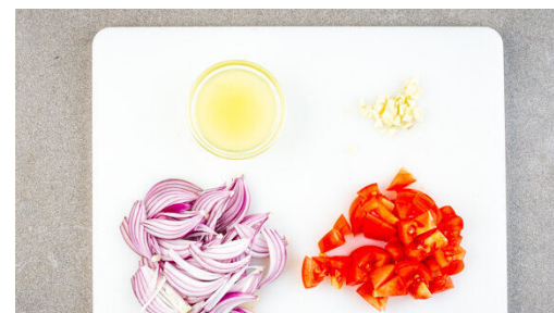
2. Zutaten vorbereiten

Die Zwiebeln , den Knoblauch und die Tomaten in die Pfanne geben und bei mittlerer Hitze ca. 5Min. mitgaren, dabei gelegentlich umrühren. 3-4EL Wasser und 2EL Zitronensaft hinzufügen und weitere ca. 2Min. garen. Mit Salz und Pfeffer abschmecken.