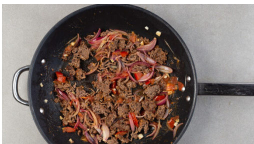
4. Gemüse mitbraten

In einem mittelgroßen Topf ausreichend gesalzenes Wasser für die Kartoffeln zum Kochen bringen. Die Kartoffeln schälen und in 3-4cm große Würfel schneiden, dann in das Wasser geben (es muss noch nicht kochen) und in 12-14Min. weich garen. In ein Sieb abgießen und abtropfen lassen.