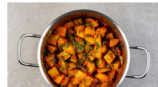
6. Kartoffeln verfeinern

Das Hackfleisch in einer großen Pfanne mit 2EL Pflanzenöl und 1 kräftigen Prise Salz bei starker Hitze ca. 2Min. anbraten, bis es leicht gebräunt ist.