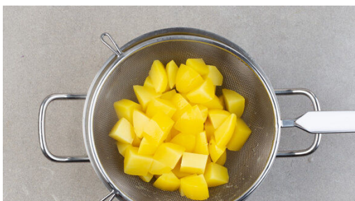
1. Kartoffeln garen

Energie 725kcal, Fett 38.1g, Kohlenhydrate 65.5g, Eiweiß 31.1g