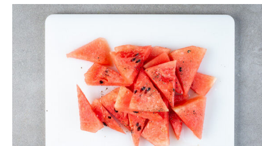
3. Melone verfeinern

Die Melonenstücke ggf. portionsweise in die Pfanne geben und auf jeder Seite 1-2Min. grillen, bis sich Grillspuren abzeichnen. Aus der Pfanne nehmen und beiseitestellen.