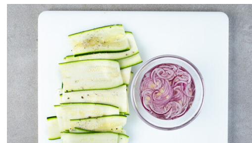
2. Zucchini vorbereiten

Eine Grillpfanne stark erhitzen. Sobald die Pfanne heiß ist, die Zucchini portionsweise hineinlegen und auf jeder Seite 2-3Min. grillen, bis die Zucchini weich ist und sich Grillspuren abzeichnen. Die Zucchini aus der Pfanne nehmen und beiseitestellen. Tipp: Wer keine Grillpfanne hat, kann auch eine normale beschichtete Pfanne verwenden.