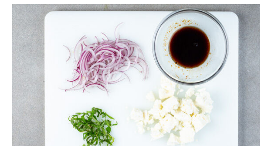
6. Salat fertigstellen

Die Melone vierteln und in 2-3cm dicke Scheiben schneiden, dabei die Schale entfernen. Die Melonscheiben mit 1EL Olivenöl sowie je 1 Prise Salz und Pfeffer vermengen, dabei darauf achten, dass beide Seiten gleichmäßig bedeckt sind.