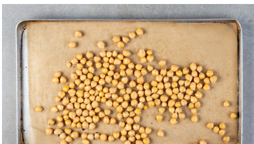
1. Kichererbsen rösten

Energie 496kcal, Fett 26.1g, Kohlenhydrate 48.3g, Eiweiß 14.2g