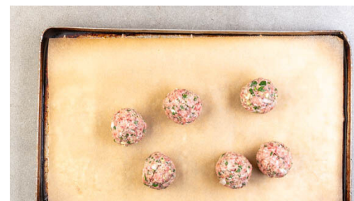
2. Hackbällchen vorbereiten

Das Brötchen auf einen Backrost geben und 4-5Min. im Ofen aufbacken.