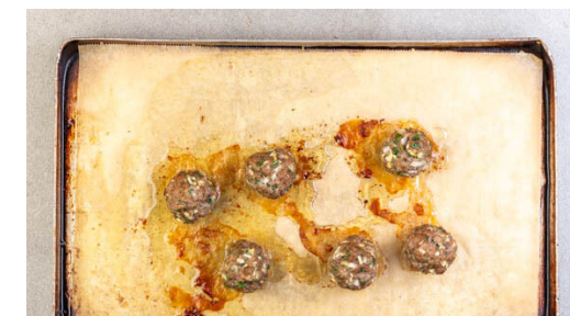
3. Hackbällchen backen

Sobald der Sellerie und der Lauch vollständig weich sind, die Suppe mit einem Stabmixer glatt pürieren, dabei 200ml Wasser hinzufügen. Ggf. mehr Wasser zugeben, bis die gewünschte Konsistenz erreicht ist. Mit Salz und Pfeffer abschmecken.