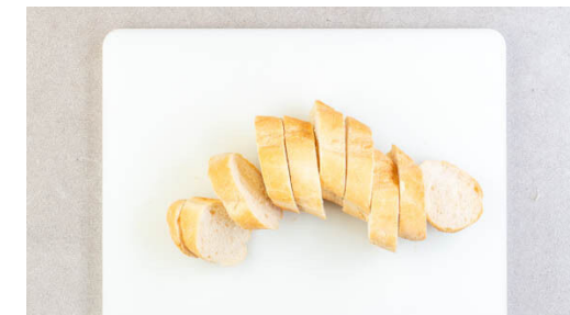
6. Brötchen schneiden

Die Hackbällchen mit 1EL Olivenöl beträufeln und 8Min. im Ofen backen. Dann auf 220°C und Grillfunktion umschalten und weitere 4-6Min. backen. Tipp: Alternativ die Temperatur auf 240°C (220°C Umluft) erhöhen, wenn keine Grillfunktion vorhanden ist. Wenn die Bällchen gar sind, das Blech aus dem Ofen nehmen und die Temperatur wieder auf 200°C (180°C Umluft) reduzieren.