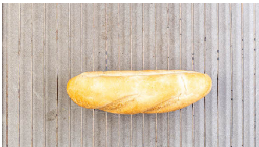
4. Brötchen aufbacken

Den Ofen auf 200°C (180°C Umluft) vorheizen. Den Sellerie schälen und mit dem Lauch in grobe Stücke schneiden, ca. 3cm des weißen Teils des Lauchs aufbewahren. In einem mittelgroßen Topf 2EL Butter schmelzen und den Sellerie und den Lauch bei mittlerer Hitze ca. 2Min. braten. Mit 350ml Wasser und je 1 kräftigen Prise Salz und Pfeffer leicht abgedeckt ca. 20Min. köcheln lassen.