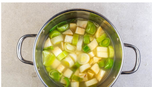
1. Suppe ansetzen

Energie 686kcal, Fett 41.9g, Kohlenhydrate 41.9g, Eiweiß 31.9g