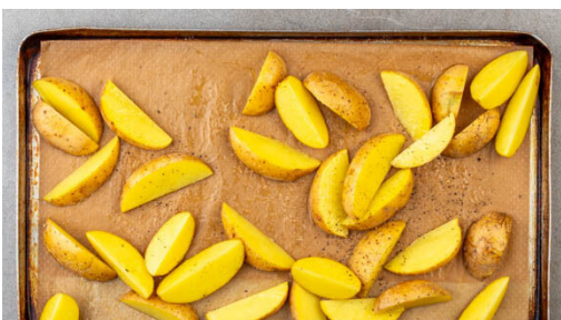
1. Kartoffeln rösten

Energie 790kcal, Fett 40.1g, Kohlenhydrate 68.5g, Eiweiß 39.5g