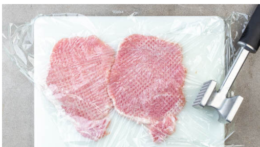
4. Fleisch klopfen

Den Backofen auf 200°C Umluft (220°C Ober-/Unterhitze) vorheizen. Die Kartoffeln je nach Größe vierteln oder achteln und auf einem mit Backpapier ausgelegten Backblech mit 1EL Pflanzenöl sowie Salz und Pfeffer vermengen. Gleichmäßig verteilen und 25-30Min. im Ofen rösten, bis die Kartoffeln goldgelb und knusprig sind.