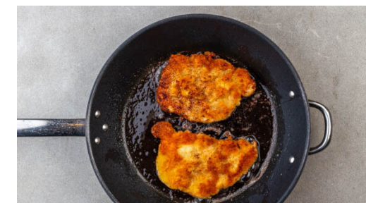
6. Schnitzel braten

Die Schnitzel von beiden Seiten mit Salz und Pfeffer würzen. 2EL Mehl, ein verquirltes Ei und die Semmelbrösel in je einen tiefen Teller oder eine Schüssel geben und die Schnitzel der Reihe nach im Mehl, im Ei und in den Semmelbröseln wenden, bis das Fleisch gleichmäßig bedeckt ist.