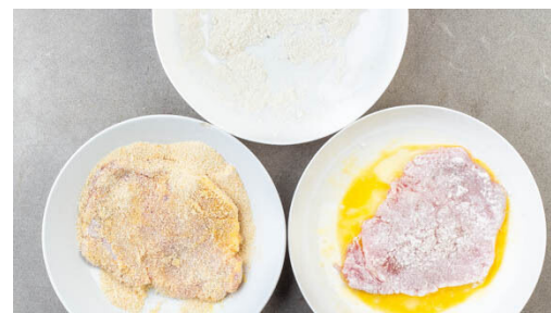
5. Schnitzel panieren

Die Dillspitzen abzupfen, fein schneiden und zu den Gurken geben. Den Salat mit 1EL Pflanzenöl, 1EL Essig sowie Pfeffer und Zucker abschmecken und bis zum Servieren ziehen lassen.