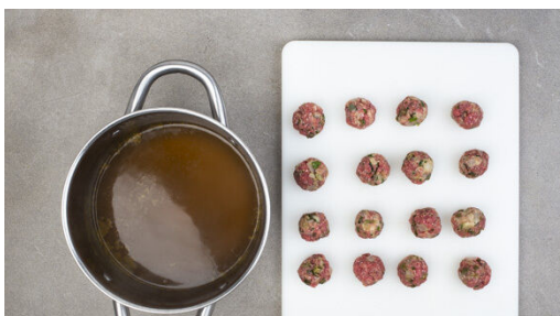
4. Klopse zubereiten

Die Zwiebel schälen, halbieren und in feine Würfel schneiden. 2EL Butter in einer großen Pfanne bei mittlerer Hitze schmelzen, dann die Zwiebeln 1-2Min. glasig dünsten. Die Pfanne beiseitestellen und die Zwiebeln abkühlen lassen.