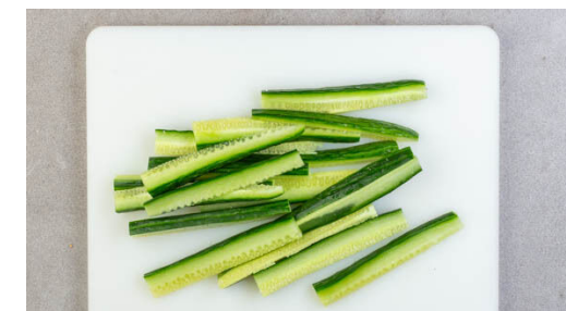
6. Gurken schneiden

Den Knoblauch schälen und mit dem Basilikum , dem Joghurt und 4EL Mayonnaise in einem hohen Gefäß zu einem cremigen Dip pürieren.