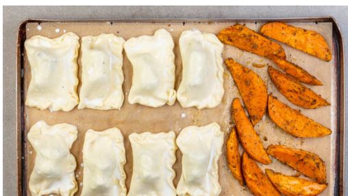
4. Wurst Bites backen

Den Teig mit dem Papier nach unten ausrollen und jeweils in 8 gleich große Quadrate schneiden. Jeweils 1 Wurststück in die Mitte eines Quadrates geben und den Teig umklappen. Die Wurst Bites mit 4EL Milch bestreichen.