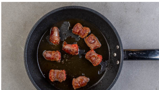
1. Würste anbraten

Energie 1226kcal, Fett 81.5g, Kohlenhydrate 84.9g, Eiweiß 37.6g