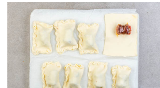
3. Wurst Bites vorbereiten

Die Süßkartoffeln schälen und in ca. 1cm breite Spalten schneiden. Auf einem mit Backpapier ausgelegten Backblech mit 2EL Olivenöl, der Gewürzmischung und je 1 kräftigen Prise Salz und Pfeffer vermengen und ca. 10Min. im Ofen backen.