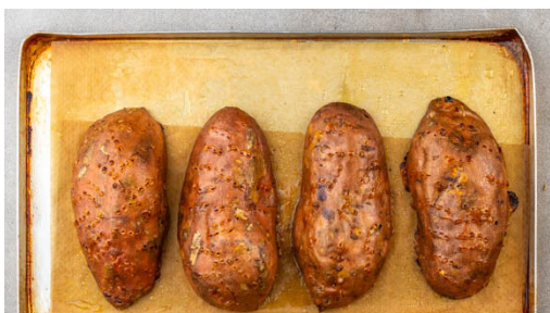
1. Süßkartoffeln backen

Energie 799kcal, Fett 48.5g, Kohlenhydrate 51.2g, Eiweiß 32.5g