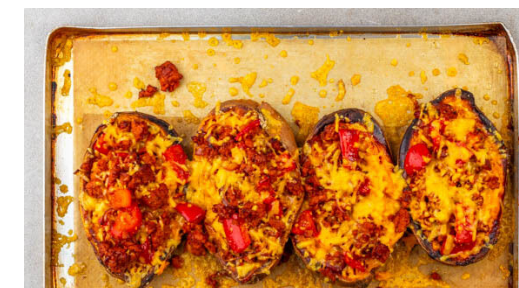
6. Süßkartoffeln überbacken

Die Paprika und die Zwiebelstreifen mit 1 Prise Salz in einer mittelgroßen Pfanne mit 1EL Olivenöl bei mittlerer bis starker Hitze 5-6Min. braten, bis sie anfangen weich zu werden. Die Chorizo und die ½ der Gewürzmischung in die Pfanne geben und 2-3Min. mitbraten, dann die Pfanne vom Herd nehmen.