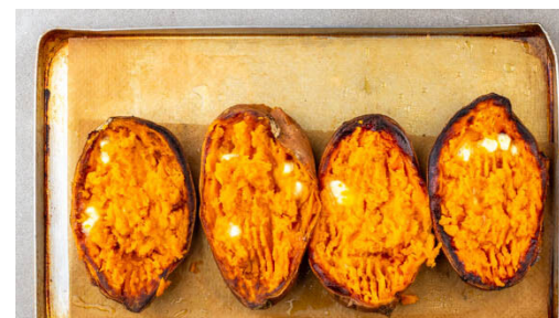
5. Süßkartoffeln füllen

Die veganen Chorizos fein zerkrümeln oder hacken. Die Paprika vierteln, entkernen und in ca. 3cm große Stücke schneiden. Die Zwiebel schälen und halbieren, eine Hälfte fein würfeln, die andere Hälfte in feine Streifen schneiden.