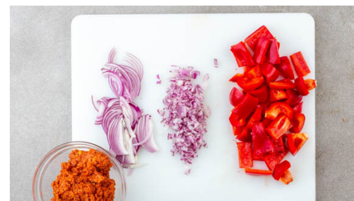
2. Zutaten schneiden

Die Tomaten fein würfeln und mit den restlichen Zwiebeln , 1EL Essig, 1 kräftigen Prise Salz und 1 Prise Zucker vermengen.