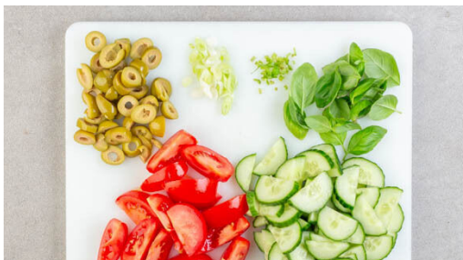
1. Zutaten vorbereiten

Energie 738kcal, Fett 44.5g, Kohlenhydrate 61.3g, Eiweiß 24.3g