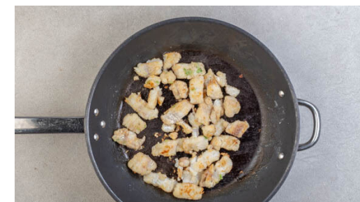
6. Fisch braten

Die Basilikumstängel mit 5EL Mehl und je 1 kräftigen Prise Salz und Pfeffer vermischen. Den Fisch mit kaltem Wasser abspülen, trocken tupfen und in der Mehlmischung wenden, dabei überschüssiges Mehl abklopfen. Den Fisch beiseitestellen.