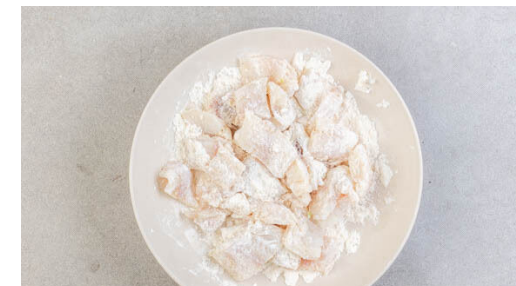
3. Fisch panieren

Die Croûtons , die Lauchzwiebeln , die Gurken , die Tomaten , die Oliven und die Basilikumblätter mit der Vinaigrette vermengen.