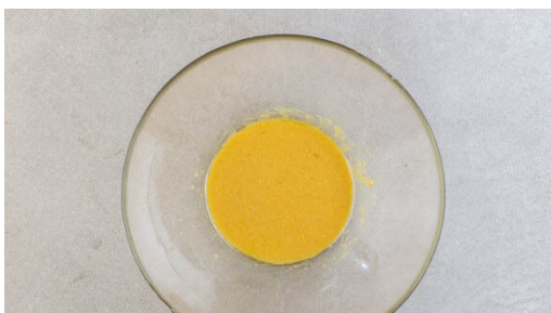
4. Vinaigrette zubereiten

Den Backofen auf 200°C (180°C Umluft) vorheizen. Die Lauchzwiebeln in feine Ringe schneiden. Die Gurke längs halbieren und quer in ca. 0,5cm dicke Stücke schneiden. Die Tomaten jeweils in 8 Spalten schneiden. Die Oliven in Ringe schneiden. Die Basilikumblätter abzupfen, die Stängel fein schneiden.