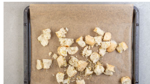
2. Croûtons backen

In einer großen Schüssel 1TL Senf, 4EL Olivenöl, 2EL Essig und je 1 kräftige Prise Salz und Pfeffer zu einer Vinaigrette verrühren.