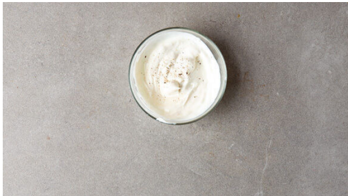
4. Crème fraîche verfeinern

Den Backofen auf 240°C (220°C Umluft) vorheizen. In einem großen Topf 1½L Wasser mit dem Brühwürz zum Kochen bringen. 300g Linsen in einem Sieb mit kaltem Wasser abspülen, in das kochende Wasser geben und einmal aufkochen lassen. Dann abgedeckt bei mittlerer bis niedriger Hitze 18-20Min. sanft köcheln lassen, bis die Linsen bissfest sind.