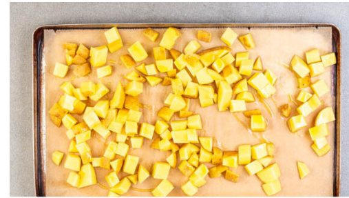
2. Kartoffeln rösten

150g Crème fraîche glatt rühren und mit Salz und Pfeffer abschmecken.