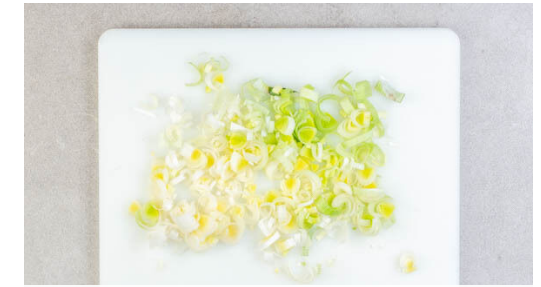
3. Lauch schneiden

Den Speck in einer mittelgroßen Pfanne bei mittlerer Hitze in 4-5Min. langsam braten, bis er schön kross ist. Nebenher die Paprika vierteln, entkernen und in feine Streifen schneiden.