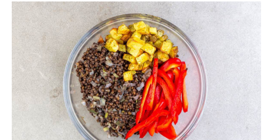
6. Salat fertigstellen

Den Lauch der Länge nach halbieren und in feine Streifen schneiden. Den Lauch ca. 10 Min. vor Ende der Kochzeit zu den Linsen hinzufügen und mitkochen. Anschließend mit den Linsen in ein Sieb abgießen und abtropfen lassen.