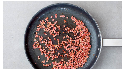
5. Speck braten

Inzwischen 750g Kartoffeln samt Schale in 1-2cm kleine Würfel schneiden und auf ein mit Backpapier ausgelegtes Backblech geben. Mit 1½EL Olivenöl beträufeln und im Ofen in 15-20Min. goldbraun und gar rösten.