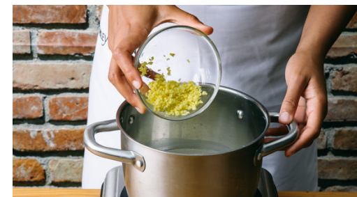
3. Reis kochen

Die Karotten schälen und mit einer Küchenreibe oder einem Messer in dünne, schräge Scheiben hobeln oder schneiden. Die Lauchzwiebeln schräg in feine Ringe schneiden. Den Ingwer schälen und fein würfeln.