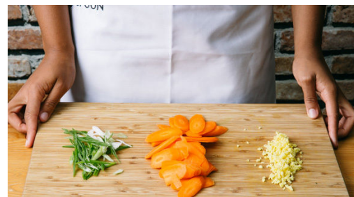
2. Gemüse schneiden

In einem mittelgroßen Topf 800ml Wasser für den Reis zum Kochen bringen. Das Fleisch mit etwas Küchenkrepp trocken tupfen, ggf. von Sehnen befreien, in ca. 12 Stücke schneiden und in der Hoisinsauce marinieren.