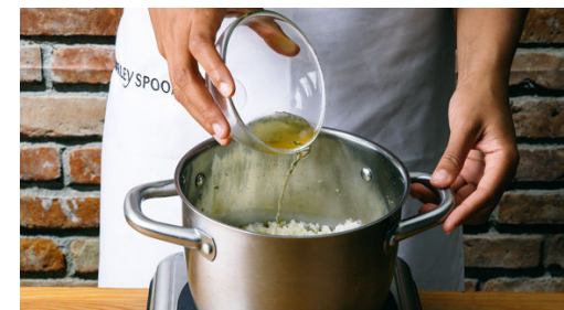
6. Reis verfeinern

Das Fleisch und das Gemüse mit der Hoisinsauce und 100ml Wasser ablöschen. Den Sesam unterrühren und alles 10-12Min. auf niedrigster Stufe köcheln lassen, bis die Karotten gar sind.