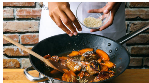
5. Sauce zubereiten

Das marinierte Fleisch aus der Hoisinsauce nehmen, die Sauce aufbewahren. Das Fleisch in einer großen Pfanne mit 1-2EL Pflanzenöl bei starker Hitze auf jeder Seite ca. 1Min. scharf anbraten. Die Karotten und ca. 2/3 der Lauchzwiebeln hinzufügen und 2-3Min. mitbraten.