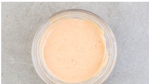
4. Sauce vorbereiten

Den Backofen auf 230°C (210°C Umluft) vorheizen. Die Kartoffeln samt Schale in breite, pommesartige Stifte schneiden. Auf einem mit Backpapier ausgelegten Backblech mit 1EL Pflanzenöl und 1 kräftigen Prise Salz vermengen und 15-20Min. im Ofen backen, dann wenden und weiter ca. 10Min. backen, bis die Pommes knusprig und leicht gebräunt sind.