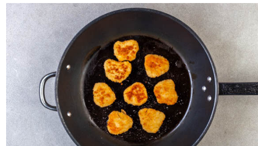
5. Fischnuggets braten

Die Gurke grob raspeln und in einem Sieb abtropfen lassen. Die Karotte ggf. schälen und ebenfalls grob raspeln. Tipp: Die Karotte muss nicht unbedingt geschält werden, allerdings kann es passieren, dass sich die Karottenraspel dadurch schneller dunkel verfärben.