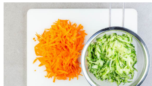
2. Gemüse raspeln

1EL Ketchup, 1EL Mayonnaise, 1TL Senf und 1TL Essig zu einer Sauce verrühren und mit je 1 Prise Salz und Pfeffer würzen.