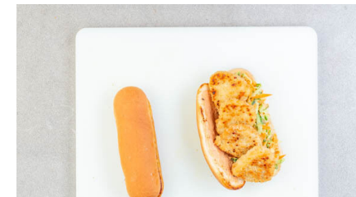
6. Brötchen aufbacken

Die Gurken und die Karotten mit 1EL Mayonnaise, 1EL Essig, je 1 kräftigen Prise Salz und Pfeffer sowie 1 Prise Zucker vermengen und beiseitestellen.