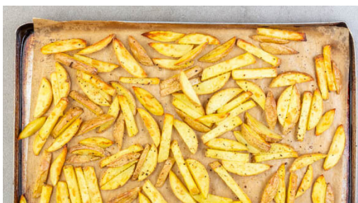
1. Pommes backen

Energie 881kcal, Fett 38.9g, Kohlenhydrate 105.0g, Eiweiß 25.1g