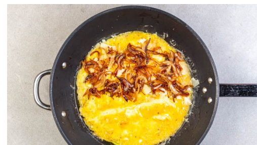
5. Omelett fertigstellen

Die Zwiebeln schälen, halbieren, in Streifen schneiden und in einer mittleren Pfanne mit 1TL Butter und dem Trüffelpulver bei mittlerer bis starker Hitze in 1-2Min. leicht braun anbraten. Mit je 1TL Balsamicoessig und Wasser ablöschen und bei niedriger Hitze unter gelegentlichem Rühren in ca. 10Min. karamellisieren lassen. Mit 1 Prise Salz würzen. Aus der Pfanne nehmen und beiseitestellen.