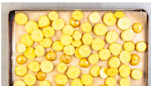
1. Kartoffeln rösten

Energie 559kcal, Fett 31.4g, Kohlenhydrate 45.7g, Eiweiß 19.6g