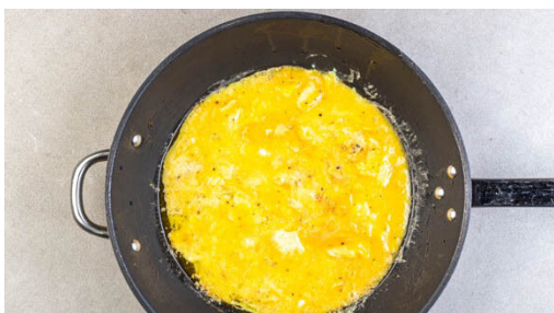
4. Omelett ansetzen

Den Backofen auf 200°C (180°C Umluft) vorheizen. Die Kartoffeln in ca. 0,5cm dicke Scheiben schneiden. Den Knoblauch schälen und durch eine Knoblauchpresse drücken oder sehr fein würfeln. Beides auf ein mit Backpapier ausgelegtes Backblech geben und mit 1EL Olivenöl und je 1 kräftigen Prise Salz und Pfeffer vermengen. In 20-30Min. im Ofen goldbraun rösten. Nach der Hälfte der Zeit wenden.