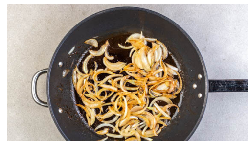
2. Zwiebeln karamellisieren

Die Pfanne auswischen. 1½TL Butter in der Pfanne bei niedriger Hitze schmelzen lassen. Die Eiermischung hineingießen, dabei die Pfanne leicht schwenken, um ein gleichmäßiges Omelett zu erhalten. Das Omelett abgedeckt 2-3Min. braten. Tipp: Die Oberseite sollte weich bleiben. Für ein festeres Omelett etwas länger braten.