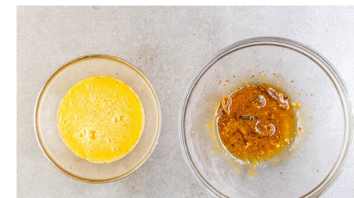
3. Dressing zubereiten

Den Käse und die restlichen Zwiebeln auf eine Seite des Omeletts geben. Die andere Seite des Omeletts über den Käse und die Zwiebeln klappen und abgedeckt weitere 1-2Min. braten. Dann aus der Pfanne nehmen.