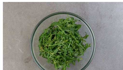
5. Salat zubereiten

Die Gnocchi aus der Pfanne nehmen und beiseitestellen. Die Pilze , die Zwiebeln und den Knoblauch in derselben Pfanne mit 2EL Olivenöl bei mittlerer Hitze 5-6Min. braten. Mit Salz und Pfeffer würzen.