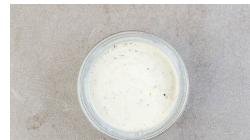
3. Crème fraîche verfeinern

Die Gnocchi in einer großen Pfanne mit 2EL Olivenöl bei mittlerer Hitze 4-5Min. anbraten, bis sie von allen Seiten goldbraun sind.