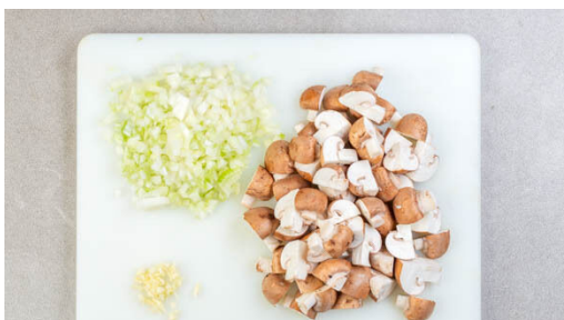
1. Pilze schneiden

Energie 830kcal, Fett 43.1g, Kohlenhydrate 94.4g, Eiweiß 20.0g