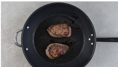
5. Fleisch garen

Die Kartoffeln schälen und in sehr dünne Scheiben schneiden oder hobeln.