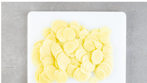
2. Kartoffeln schneiden

Die Zwiebeln und den Knoblauch in einer Auflaufform verteilen, dabei etwas Butter zurückhalten. Die Kartoffelscheiben fächerweise einschichten und mit der restlichen Butter beträufeln. Mit Salz und Pfeffer würzen und die Kartoffeln 25-30Min. im Ofen backen, bis sie gar sind.