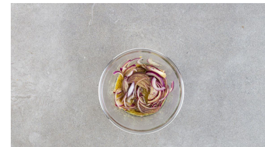
6. Dressing zubereiten

In einer kleinen Pfanne 4EL Butter bei mittlerer Hitze schmelzen und aufschäumen lassen, dann die Zwiebelwürfel und den Knoblauch unterrühren und ca. 1Min. anbraten. Die Pfanne vom Herd nehmen.