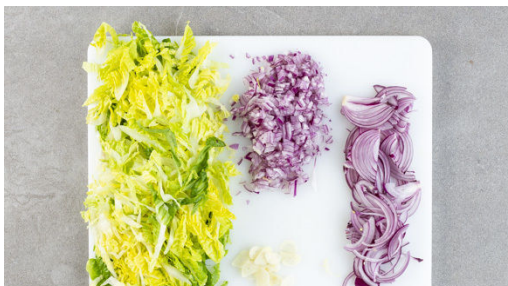
1. Salat schneiden

Energie 660kcal, Fett 35.1g, Kohlenhydrate 47.5g, Eiweiß 35.9g