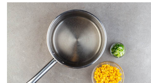
3. Zutaten vorbereiten

Die ½ des Ingwers oder mehr nach Geschmack schälen, fein reiben und mit 1EL Mayonnaise und 1TL Essig verrühren.