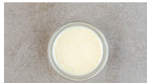
2. Ingwercreme anrühren

Den Backofen auf 220°C (200°C Umluft) vorheizen. Die ½ der Sojasauce und 1EL Essig mit je 1 Prise Zucker und Salz verrühren. Den Weißkohl 1-2Min. gründlich mit dem Dressing verkneten.