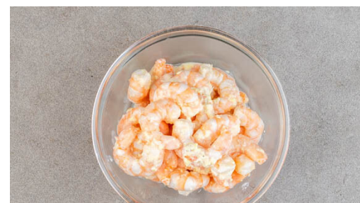
5. Garnelen zubereiten

Die Brötchen halbieren und mit der Schnittseite nach oben auf einem Backblech in 3-4Min. knusprig aufbacken.