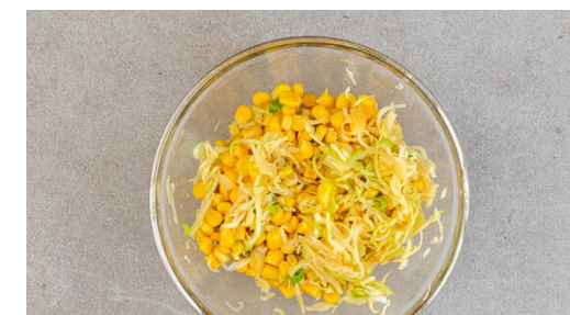
6. Mais-Slaw mischen

Die Garnelen in einem Sieb mit kaltem Wasser abspülen, in das kochende Wasser geben und bei mittlerer bis starker Hitze 1-2Min. köcheln, bis sie rosa und durchgegart sind. In ein Sieb abgießen, trocken tupfen und mit der Ingwercreme vermengen.