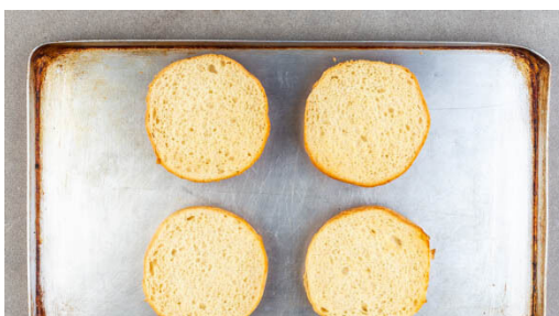
4. Brötchen aufbacken

Einen mittelgroßen Topf ca. 1cm hoch mit Wasser befüllen und das Wasser zum Kochen bringen. Die Lauchzwiebel längs halbieren und quer in feine Streifen schneiden. Den Mais in ein Sieb abgießen und abtropfen lassen.