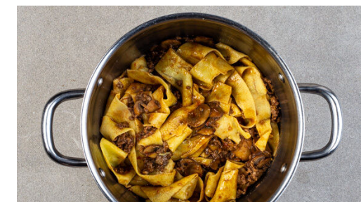
6. Pasta vermengen

Die Lasagneblätter der Länge nach in ca. 2,5cm breite Streifen schneiden, in das kochende Wasser geben und in ca. 5Min. bissfest kochen. Mit einer Tasse etwas Pastawasser abschöpfen, dann die Pasta in ein Sieb abgießen und abtropfen lassen.