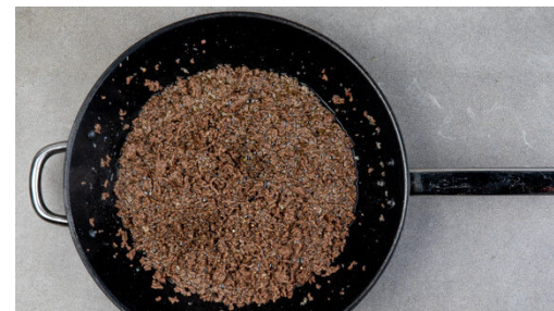
2. Hackfleisch braten

In einem mittelgroßen Topf ausreichend gesalzenes Wasser für die Pasta zum Kochen bringen. Die Pilze ggf. säubern und in dünne Scheiben schneiden, dann in einer großen Pfanne mit 1EL Pflanzenöl oder Butter und 1 kräftigen Prise Salz bei mittlerer Hitze in 7-8Min. goldbraun braten.