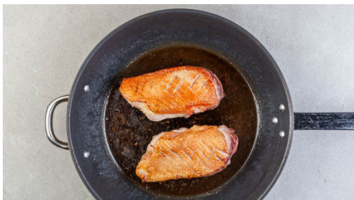
4. Fleisch braten

Das Brühgewürz in 1,8L heißem Wasser auflösen. 300ml Brühe abschöpfen und für die Sauce beiseitestellen, 1,5L Brühe werden für das Risotto benötigt. Den Lauch längs halbieren und quer in feine Streifen schneiden. Den Lauch und den Zitronenthymian in einem großen Topf mit 2EL Olivenöl bei starker Hitze 1-2Min. braten, bis der Lauch weich wird.