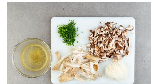
3. Zutaten vorbereiten

Die Pfanne nicht auswaschen und die Pilze im Bratfett mit 1 kräftigen Prise Salz bei starker Hitze 2-3Min. braten. Nach 1-2Min. 1TL Mehl unterrühren und die Hitze reduzieren. 300ml Brühe angießen. Abgedeckt bei mittlerer Hitze 7-8Min. köcheln lassen, dabei ggf. mehr Wasser zugeben. Das Fleisch am Ende zugeben und kurz erwärmen, aber nicht zu lange garen, damit es weich bleibt.