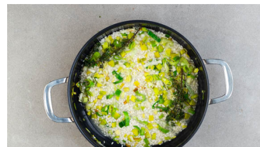
2. Risotto kochen

Das Fleisch trocken tupfen, die Haut mehrmals kreuzweise einschneiden. Mit Salz und Pfeffer würzen und mit der Haut nach unten in eine kalte große Pfanne legen. Bei maximal mittlerer Hitze 8-10Min. sanft braten, bis die Haut knusprig ist, dabei das Fett austreten lassen. Wenden und bei mittlerer bis starker Hitze ca. 1Min. braten. Auf einem Teller abgedeckt beiseitestellen.