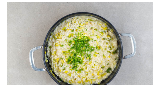
6. Risotto fertigstellen

Die Shiitakepilze grob in Stücke schneiden, die Austernpilze in dünne Streifen zupfen oder schneiden. Den Schnittlauch in kleine Röllchen schneiden. Den Käse fein hacken. Die aufbewahrte Brühe mit 1EL Essig und 1EL Honig verrühren.