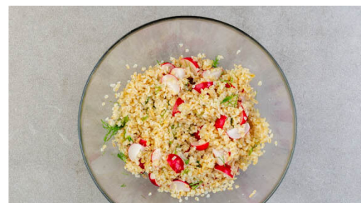
5. Salat zubereiten

Den Bulgur in das kochende Salzwasser rühren und abgedeckt bei niedriger Hitze 5-7Min. sanft köcheln, bis das Wasser aufgesaugt ist. Die Karotten mit 1TL Salz in den zweiten Topf mit kochendem Wasser geben und in ca. 7Min. weich kochen. Das Fleisch trocken tupfen, jeweils horizontal halbieren und mit 1EL Olivenöl, dem Knoblauch und ½TL Salz vermengen.