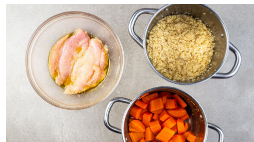
2. Fleisch würzen

Mit einer Tasse etwas Kochwasser abschöpfen, dann die Karotten in ein Sieb abgießen und abtropfen lassen. Die Karotten zurück in den Topf geben und mit dem Zwiebel-Walnuss-Mix , 2EL Olivenöl und 3TL Essig fein pürieren, dabei nach Bedarf etwas Kochwasser hinzufügen. Mit Salz und Pfeffer abschmecken.