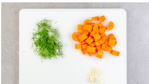
1. Zutaten vorbereiten

Energie 837kcal, Fett 39.8g, Kohlenhydrate 67.7g, Eiweiß 44.9g