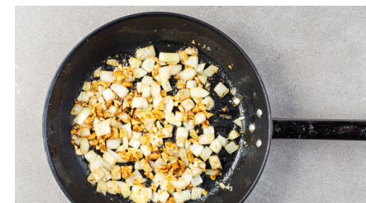
3. Zwiebeln anbraten

Die Radieschen vierteln. 2EL Olivenöl, 2EL Essig, 2TL Honig und 2TL Senf mit je 1 kräftigen Prise Salz und Pfeffer verrühren. Die Radieschen , den Dill und den Bulgur mit dem Dressing zu einem Salat vermengen.