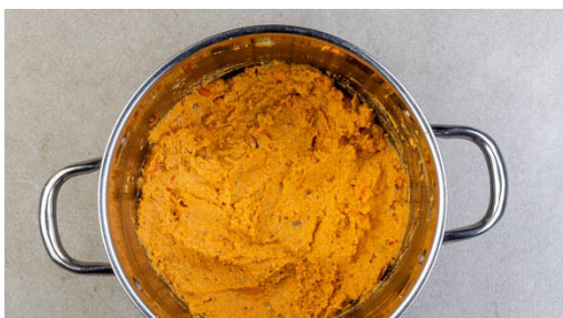
4. Pkhali pürieren

In einem mittelgroßen Topf 600ml leicht gesalzenes Wasser für den Bulgur zum Kochen bringen. In einem zweiten mittelgroßen Topf 1L Wasser für die Karotten zum Kochen bringen. Die Karotten ggf. schälen und grob schneiden. Den Dill samt Stängeln grob schneiden. Den Knoblauch schälen und grob würfeln.