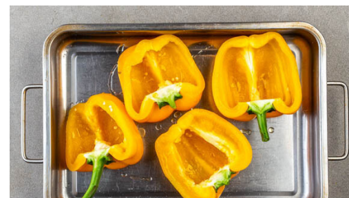
2. Paprika vorbacken

Die Kichererbsen abgießen, mit den Zucchiniraspeln und 80g Haferflocken vermengen und mit je 1 kräftigen Prise Salz und Pfeffer würzen.