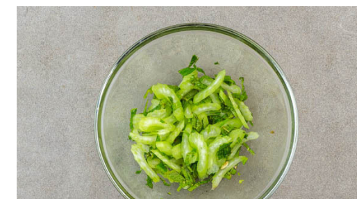
6. Selleriesalat zubereiten

Die Petersilie grob hacken. Den Knoblauch schälen und fein würfeln. Das Tomatenmark , die passierten Tomaten , 150ml Wasser, 2EL Olivenöl, die Petersilie , den Knoblauch , die Gewürzmischung , 1TL Zucker und je 1 kräftige Prise Salz und Pfeffer zu einer Sauce verrühren.