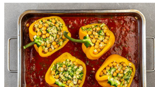
5. Paprika füllen

Inzwischen die Paprika halbieren und entkernen. Die Paprikahälften von innen mit insgesamt 1EL Olivenöl beträufeln und jeweils mit 1 Prise Salz würzen. In einer tiefen Auflaufform platzieren und 8-10Min. im Ofen vorbacken.