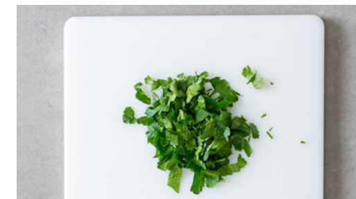
6. Petersilie hacken

Die Minestrone in den Topf geben und ca. 30Sek. anrösten.