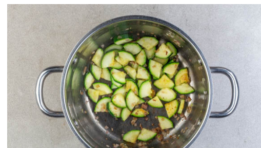
2. Gemüse anbraten

Die Tomaten hinzugeben, das heiße Wasser vorsichtig angießen und alles bei mittler bis starker Hitze ca. 10Min. köcheln lassen.