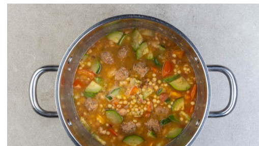
5. Hackbällchen kochen

3EL Olivenöl in einem mittelgroßen Topf bei niedriger bis mittlerer Hitze erwärmen. Die Schalotten und die Zucchini in den Topf geben und 1-2Min. anbraten. Dann mit 1 kräftigen Prise Salz würzen.