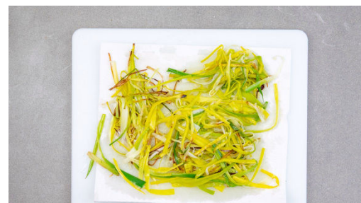
5. Lauch frittieren

Die Spargelstangen in ca. 2cm große Stücke schneiden. Die Kartoffeln schälen und in 2-3cm große Stücke schneiden. Die Schalotten schälen, halbieren und in feine Streifen schneiden. Die Zitrone halbieren und auspressen.