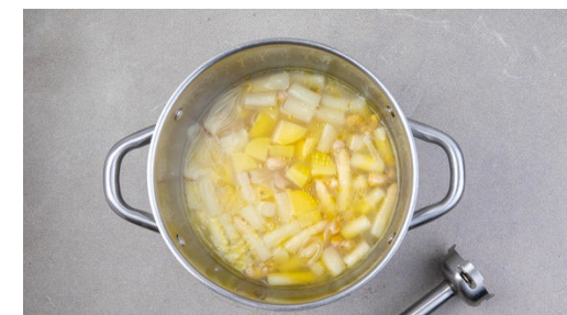
6. Suppe pürieren

Die Spargelschalen in ein Sieb abgießen, dabei das Spargelwasser in einem Messbecher oder einem zweiten Topf auffangen. Die Schalotten in demselben Topf mit 2EL Olivenöl und 1 Prise Salz in 2-3Min. glasig anbraten. Den Spargel , die Kartoffeln , die Cashews und 1EL Zitronensaft zugeben, mit 1,5L Spargelwasser ablöschen und alles ca. 15Min. bei mittlerer Hitze köcheln.