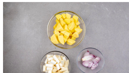
2. Gemüse schneiden

Inzwischen den Lauch einmal quer halbieren, dann die beiden Lauchstücke längs halbieren. Den Lauch in lange, möglichst dünne Streifen schneiden, in einer Schüssel mit 1 kräftigen Prise Salz würzen und ca. 4Min. ziehen lassen. Dann ½EL Mehl untermengen.