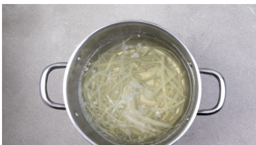
1. Spargelsud zubereiten

Energie 618kcal, Fett 37.0g, Kohlenhydrate 56.9g, Eiweiß 12.9g