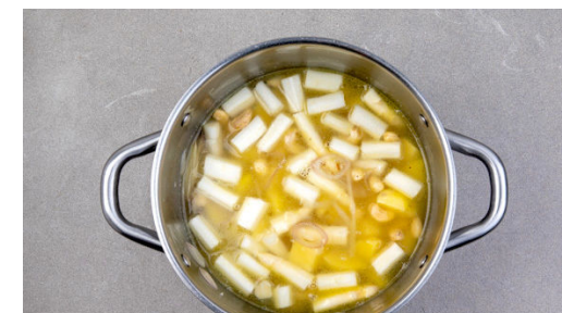
3. Suppe ansetzen

In einer mittelgroßen Pfanne 5EL Pflanzenöl stark erhitzen und die ½ des Lauchs im heißen Öl in 1-2Min. knusprig frittieren. Den Lauch mit einer Schaumkelle aus dem Öl nehmen und auf Küchenkrepp abtropfen lassen. Den Vorgang mit dem restlichen Lauch wiederholen.