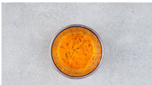
4. Relish zubereiten

In einem mittelgroßen Topf 1L Wasser mit 1/2TL Salz zum Kochen bringen. Die Enden der Bohnen entfernen und die Bohnen quer halbieren. Den Bulgur in das kochende Wasser geben und ca. 10Min. kochen. Nach 3-5Min. die Bohnen zugeben und mitgaren. In einem feinmaschigen Sieb abtropfen und abkühlen lassen.