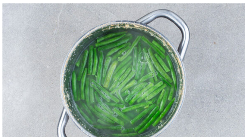
1. Bulgur und Bohnen kochen

Vergiss nicht, das Gemüse vor der Zubereitung gründlich zu waschen, insbesondere grünes Blattgemüse und Salate.