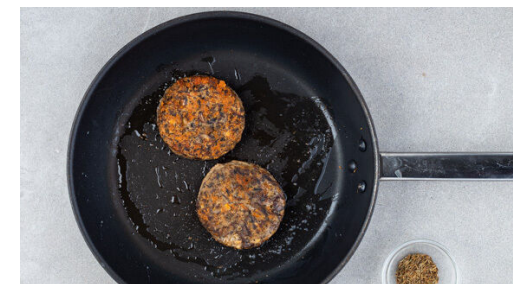
3. Pattys braten

Die Kräuter abzapfen und grob schneiden. Die Zitronenschale abreiben, dann die Zitronen halbieren und auspressen.