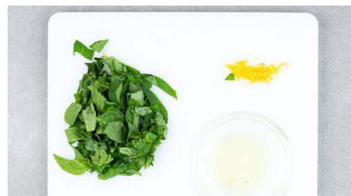
5. Kräuter schneiden

Die Zwiebeln schälen und in Spalten schneiden. 2EL Essig mit 2EL Wasser, 1/2TL Zucker und 1 Prise Salz verrühren, bis sich der Zucker aufgelöst hat. Mit den Zwiebeln vermengen und beiseitestellen.