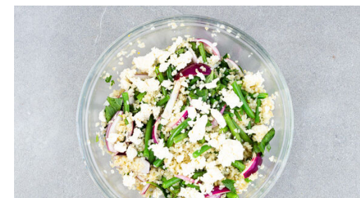
6. Salat fertigstellen

Den Kreuzkümmel in einer großen Pfanne ohne Zugabe von Fett bei mittlerer Hitze 1-2min. anrösten, bis der Kreuzkümmel duftet. Aus der Pfanne nehmen und beiseitestellen. Die Champignonpattys in der Pfanne mit 2EL Olivenöl auf jeder Seite 4-5Min. goldbraun anbraten, dann leicht schräg in dicke Scheiben schneiden.