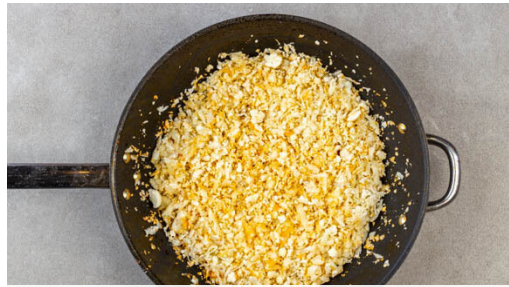
1. Blumenkohlreis garen

Energie 419kcal, Fett 17.4g, Kohlenhydrate 28.1g, Eiweiß 37.3g