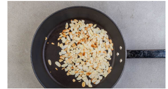
3. Mandeln anrösten

Den Joghurt mit 1TL Mehl verrühren. Den Knoblauch schälen und fein würfeln. Die Karotte ggf. schälen, längs halbieren und quer in feine Scheiben schneiden. Die Tomaten in ca. 2cm große Würfel schneiden, dabei den Strunk entfernen.