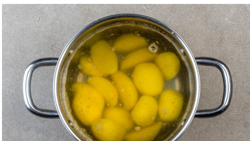
1. Kartoffeln kochen

Energie 678kcal, Fett 44.9g, Kohlenhydrate 34.0g, Eiweiß 31.6g