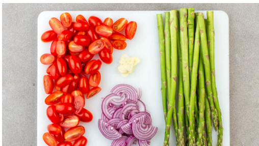
4. Gemüse vorbereiten

Den Backofen auf 75°C Umluft vorheizen. In einem mittelgroßen Topf ausreichend gesalzenes Wasser für die Kartoffeln zum Kochen bringen. Die Kartoffeln schälen, größere Kartoffeln halbieren. Die Kartoffeln , in das kochende Wasser geben und in 15-20Min. gar kochen. In ein Sieb abgießen und abkühlen lassen.