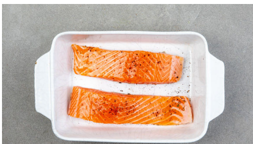
2. Lachs garen

Die hölzernen Enden des Spargels abschneiden. Die Zwiebeln schälen, halbieren und in feine Streifen schneiden. Den Knoblauch schälen und in feine Scheibchen schneiden. Die Kirschtomaten halbieren.