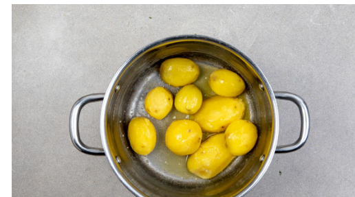
6. Kartoffeln verfeinern

Die ½ der Estragonblätter oder mehr von den Stängeln zupfen und fein schneiden. 3EL Mayonnaise mit dem Estragon und 1TL hellem Essig verrühren und den Dip mit Salz und Pfeffer abschmecken.