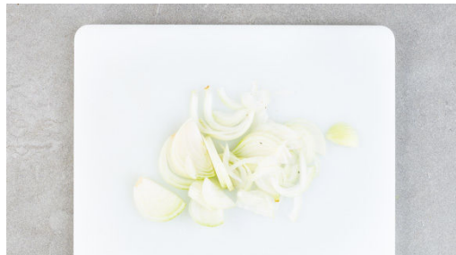
4. Zwiebeln schneiden

Den Backofen auf 240°C (220°C Umluft) vorheizen. Die Kartoffeln schälen und in ca. 0,5cm dünne Scheiben schneiden. Die Thymianblätter abstreifen und fein hacken. Die Rosmarinnadeln abzupfen und ebenfalls grob hacken. Den Knoblauch schälen und mit einem Messer flach zerdrücken.