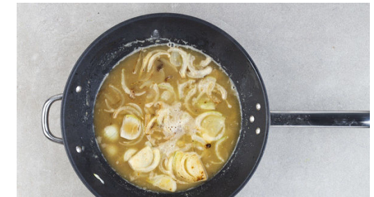
6. Sauce zubereiten

Die Kartoffelscheiben gleichmäßig in eine Auflaufform schichten, mit der Sahnesauce begießen und im Ofen in 25-30Min. goldbraun backen. Tipp: Das Gratin ist fertig, wenn man mit einem Spieß leicht durch die Kartoffeln stechen kann.