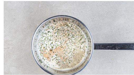
2. Sahnesauce zubereiten

Inzwischen die Zwiebeln schälen, halbieren und in feine Streifen schneiden.