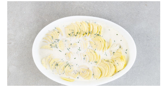
3. Gratin backen

Die veganen Steaks trocken tupfen und mit je 1 kräftigen Prise Salz und Pfeffer einreiben. Die veganen Steaks in einer großen Pfanne mit 2EL Olivenöl bei mittlerer Hitze auf beiden Seiten 3-4Min. goldbraun braten. Dann auf einem Teller abgedeckt beiseitestellen und warm halten. Die Pfanne nicht auswaschen.