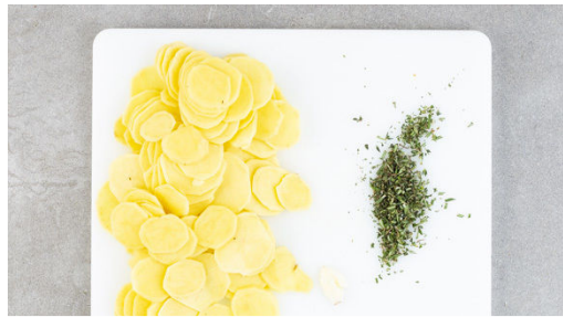
1. Zutaten vorbereiten

Energie 623kcal, Fett 30.3g, Kohlenhydrate 54.9g, Eiweiß 27.5g