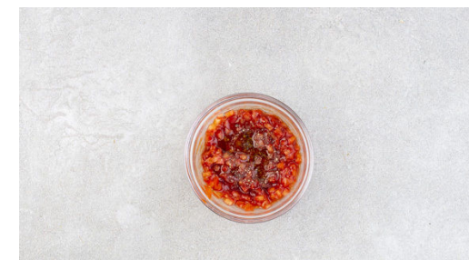
3. Dip anrühren

Das Fleisch trocken tupfen und waagrecht halbieren, sodass insgesamt 4 Schnitzel entstehen. Diese ggf. etwas dünner klopfen und mit Salz und Pfeffer würzen, dann in einer großen Pfanne mit 2EL Olivenöl bei starker Hitze auf jeder Seite 1-2Min. scharf anbraten, bis das Fleisch durch ist. Auf einem Teller abgedeckt beiseitestellen.