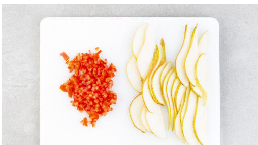
1. Birnen schneiden

Energie 751kcal, Fett 27.3g, Kohlenhydrate 83.9g, Eiweiß 38.3g