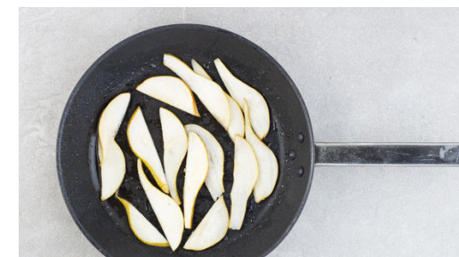
6. Birnen braten

Die Tomatenwürfel mit 4EL Ketchup und einigen Tropfen Trüffelöl verrühren. Mit Salz und Pfeffer sowie ggf. mehr Trüffelöl abschmecken.