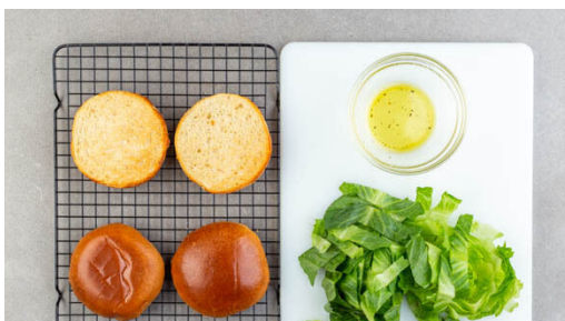
4. Salat vorbereiten

Den Backofen auf 230°C (210°C Umluft) vorheizen. Die Birnen vierteln, den Strunk und das Kerngehäuse entfernen, dann der Länge nach in ca. 0,5cm dünne Scheiben schneiden. Die Tomaten vierteln, entkernen und in sehr kleine Würfel schneiden.