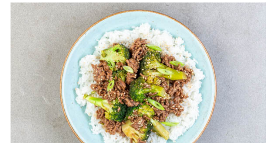
6. Anrichten und servieren

Das vegane Hack in einer großen Pfanne oder einem Wok mit 2EL Pflanzenöl bei starker Hitze 2-3Min. anbraten.