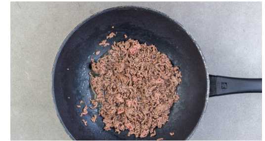
3. Hack anbraten

Mit ca. 170ml Wasser ablöschen und unter Rühren einmal aufkochen lassen. Die Hitze reduzieren, den Brokkoli zugeben und alles abgedeckt bei mittlerer Hitze 6-9Min. köcheln lassen, bis die Flüssigkeit leicht eingedickt und der Brokkoli gar ist, ggf. esslöffelweise mehr Wasser zugeben. Mit Salz, Pfeffer und Zucker abschmecken.