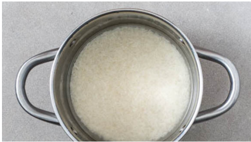
1. Reis kochen

Energie 698kcal, Fett 26.1g, Kohlenhydrate 74.7g, Eiweiß 38.5g