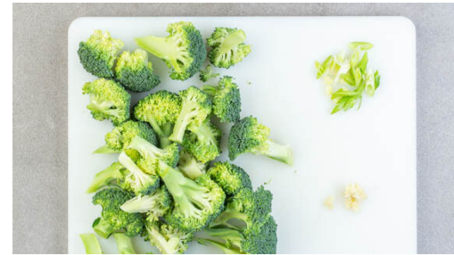
2. Gemüse vorbereiten

2EL Mehl einrühren und ca. 30Sek. weiterbraten, dann die Ingwer-Würzsauce und den Knoblauch untermengen und alles ca. 1Min. köcheln lassen. 2EL hellen Essig und 1TL Zucker einrühren und weitere ca. 30Sek. köcheln.