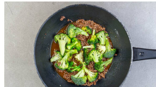
5. Brokkoli garen

Den Brokkoli in mundgerechte Röschen schneiden, nach Wunsch den Strunk in kleine Würfel schneiden und mitverwenden. Die Lauchzwiebeln in feine Röllchen schneiden. Den Knoblauch schälen und sehr fein würfeln oder durch eine Knoblauchpresse drücken.