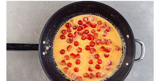
3. Sauce zubereiten

Die Zucchini auf einem mit Backpapier ausgelegten Backblech mit 1EL Pflanzenöl und 1 kräftigen Prise Salz vermengen, gleichmäßig verteilen und 10-15Min. im Ofen goldbraun rösten. In einem mittelgroßen Topf ausreichend gesalzenes Wasser für die Gnocchi zum Kochen bringen.