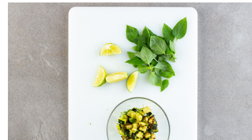
5. Garnitur vorbereiten

Die Gnocchi in das kochende Wasser geben und 3-4Min. garen, bis die Gnocchi an der Oberfläche schwimmen. In ein Sieb abgießen und in die Sauce rühren.