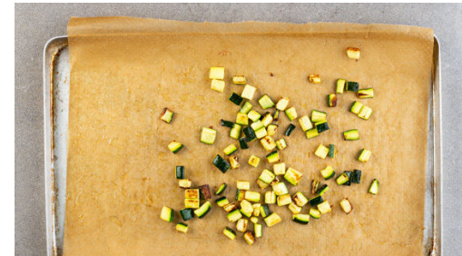
2. Zucchini rösten

Den Backofen auf 220°C Umluft (240°C Ober-/Unterhitze) vorheizen. Die Zucchini der Länge nach halbieren und in ca. 1cm große Würfel schneiden. Die Kirschtomaten halbieren.