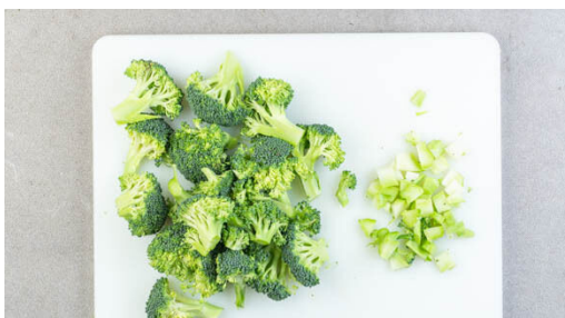
1. Brokkoli schneiden

Energie 654kcal, Fett 54.4g, Kohlenhydrate 12.3g, Eiweiß 26.3g