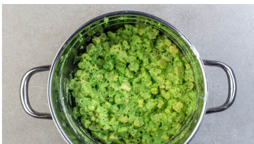
5. Mac 'n' Cheese zubereiten

Den Brokkoli in das kochende Wasser geben und je nach Größe der Röschen 6-9Min. leicht köcheln lassen, bis sich ein Messer leicht hineinstecken lässt. Die Pasta in das kochende Wasser geben und ca. 5Min. kochen, dann in ein Sieb abgießen, zurück in den Topf geben und abgedeckt warm halten. Den Brokkoli abgießen und beiseitestellen. Den Topf aufbewahren.