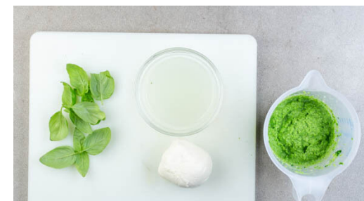
3. Pesto zubereiten

Das Pesto und die Käsesauce gründlich mit der Pasta vermengen. Die ½ der Pasta-Mischung in eine mittelgroße Auflaufform geben und die ½ des Mozzarellas in Stücke zupfen und darüber verteilen.