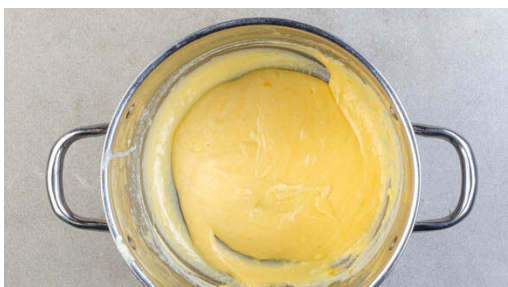
4. Sauce zubereiten

Den Backofen auf 180°C (160°C Umluft) vorheizen. In einem großen Topf ausreichend gesalzenes Wasser für die Pasta zum Kochen bringen. In einem mittelgroßen Topf ausreichend gesalzenes Wasser für den Brokkoli zum Kochen bringen. Den Brokkoli in mundgerechte Röschen schneiden, den Strunk ggf. schälen und grob würfeln.