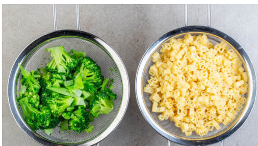
2. Brokkoli und Pasta kochen

Schau dir das Rezept in deinem Konto auf marleyspoon.de an. #marleyspooning