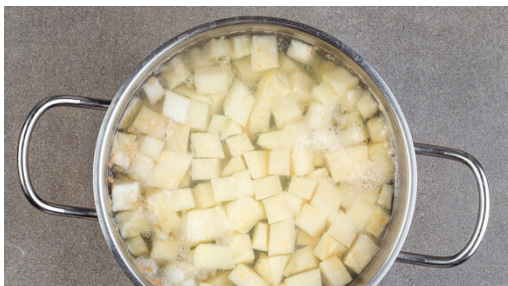
1. Sellerie kochen

Energie 770kcal, Fett 49.0g, Kohlenhydrate 21.4g, Eiweiß 55.6g