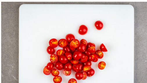
2. Tomaten schneiden

Die weißen Lauchzwiebelringe und den Knoblauch in einer großen Pfanne mit 1EL Butter bei mittlerer Hitze 1-2Min. farblos anbraten. Die Kirschtomaten dazugeben und durchschwenken, dann das Tomatenmark unterrühren. Mit 300ml Wasser ablöschen und die Sauce ca. 2Min. sanft köcheln lassen. Mit 1TL Honig sowie Salz und Pfeffer nach Geschmack würzen.