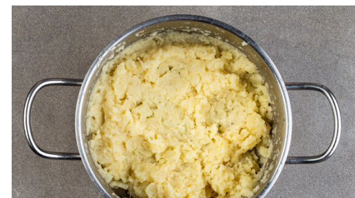
6. Sellerie stampfen

Die Lauchzwiebel in dünne Ringe schneiden, den weißen und grünen Teil separat aufbewahren. Den Knoblauch schälen und in hauchdünne Scheibchen schneiden.